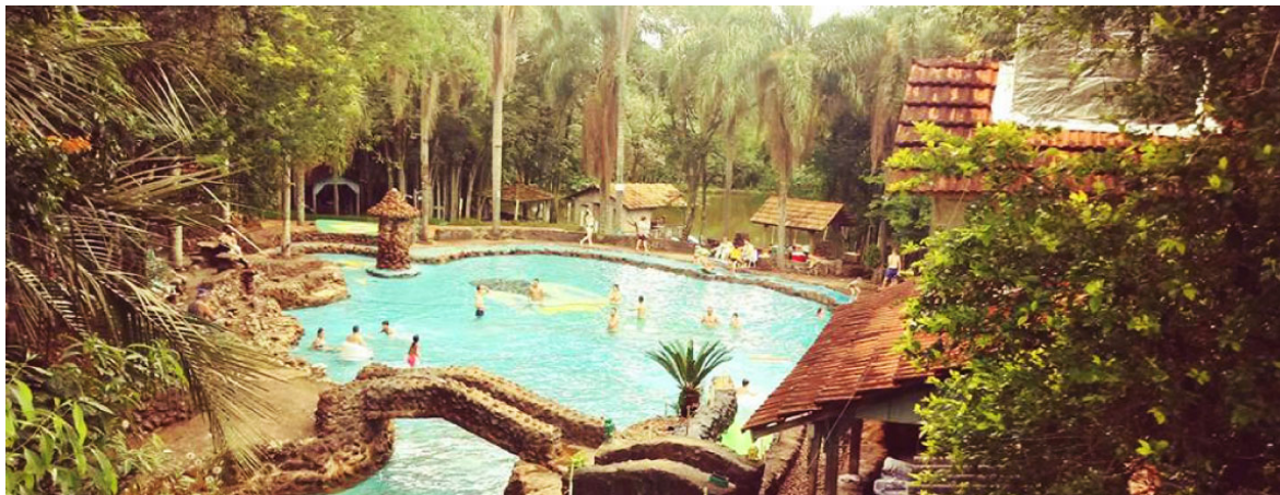
Recanto das Pedras