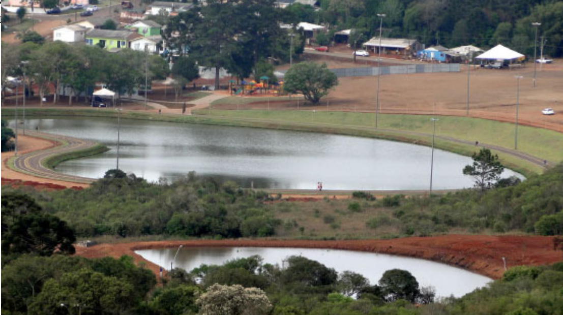
Centro de Eventos e Parque do Lago

O Parque do Lago é o local que conta com pistas de kart e caminhada, parque infantil e centro de eventos.