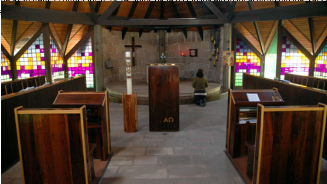
Mosteiro Trapista

Além de exaltarem a cultura local, os recantos de fé da cidade emanam espiritualidade, seja no Mosteiro Trapista