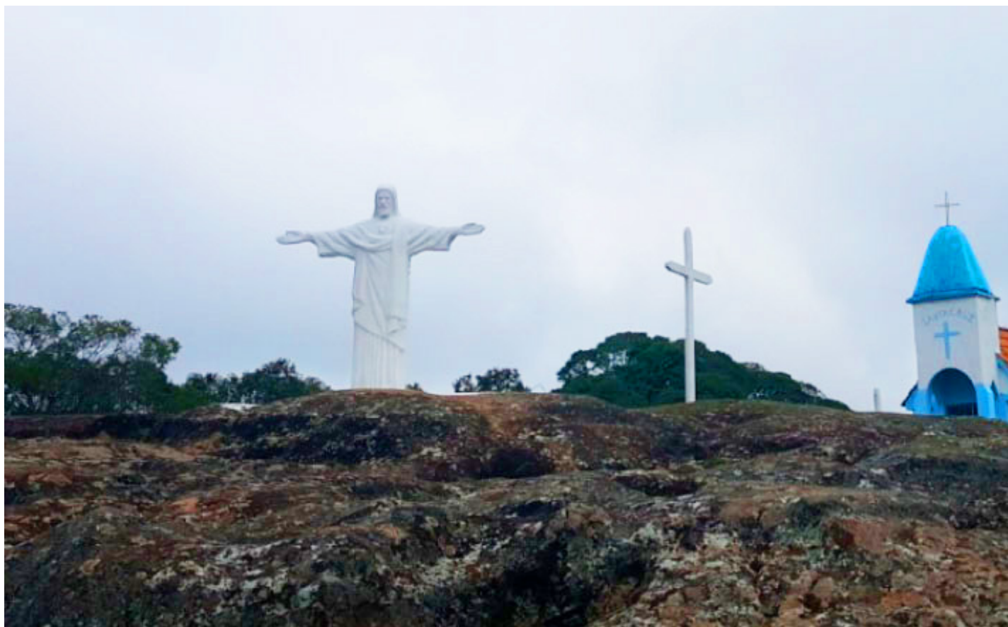
Igreja de Sant'Ana