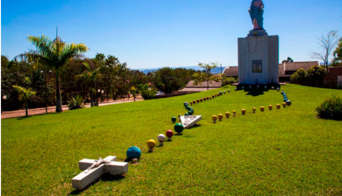
Praça da Santa