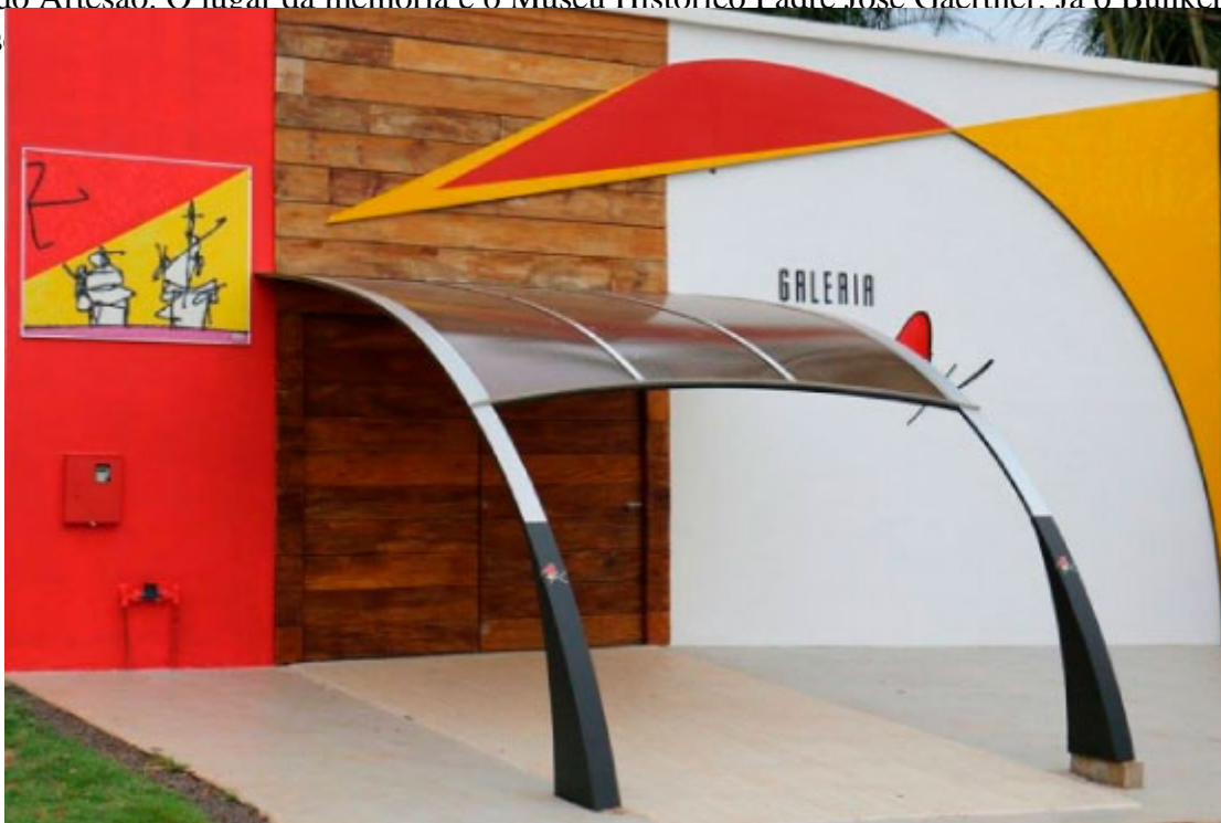
Galeria AK

Arte, cultura e história marcam forte presença em Marechal Cândido Rondon. Para agradar os olhos, tem as exposições da Galeria AK, as belezas arquitetônicas Centro de Eventos Werner Wanderer e as peças da Casa do Artesão. O lugar da memória é o Museu Histórico Padre José Gaertner. Já o Bunker Berliin representa as tradições locais.