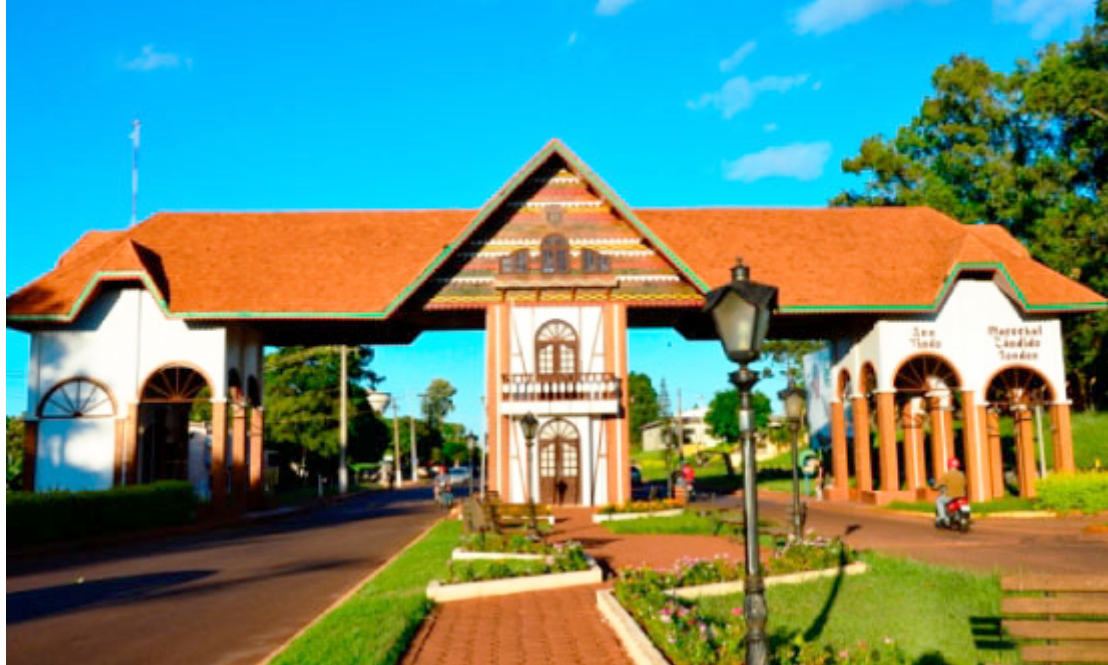
Portal da Cidade - Foto: Prefeitura de Marechal Cândido Rondon