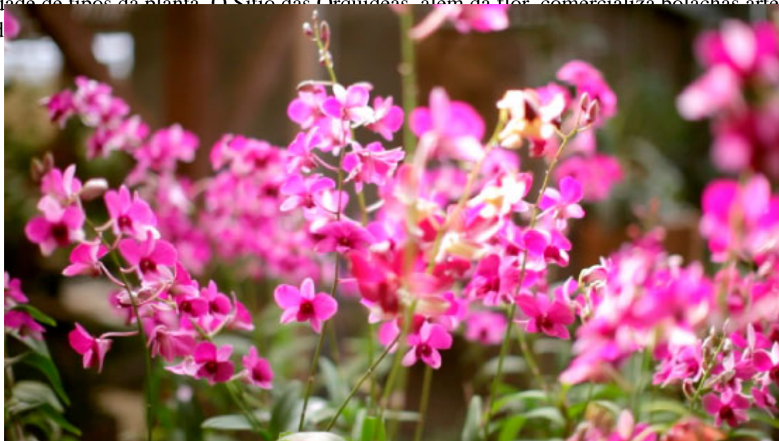
Sítio das Orquídeas

Se você é apaixonado por orquídeas, não deixe de visitar os orquidários locais. O esplendor oferece grande variedade de tipos de planta. O Sítio das Orquídeas, além da flor, comercializa bolachas artesanais que são uma delícia.