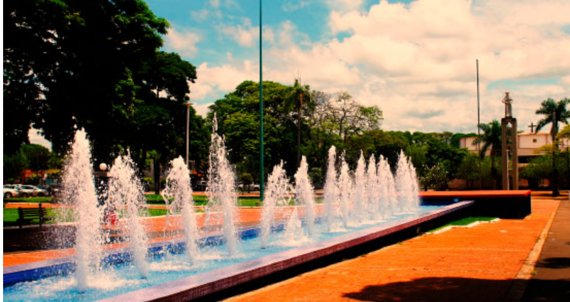
Praça Amadeo Piovesan