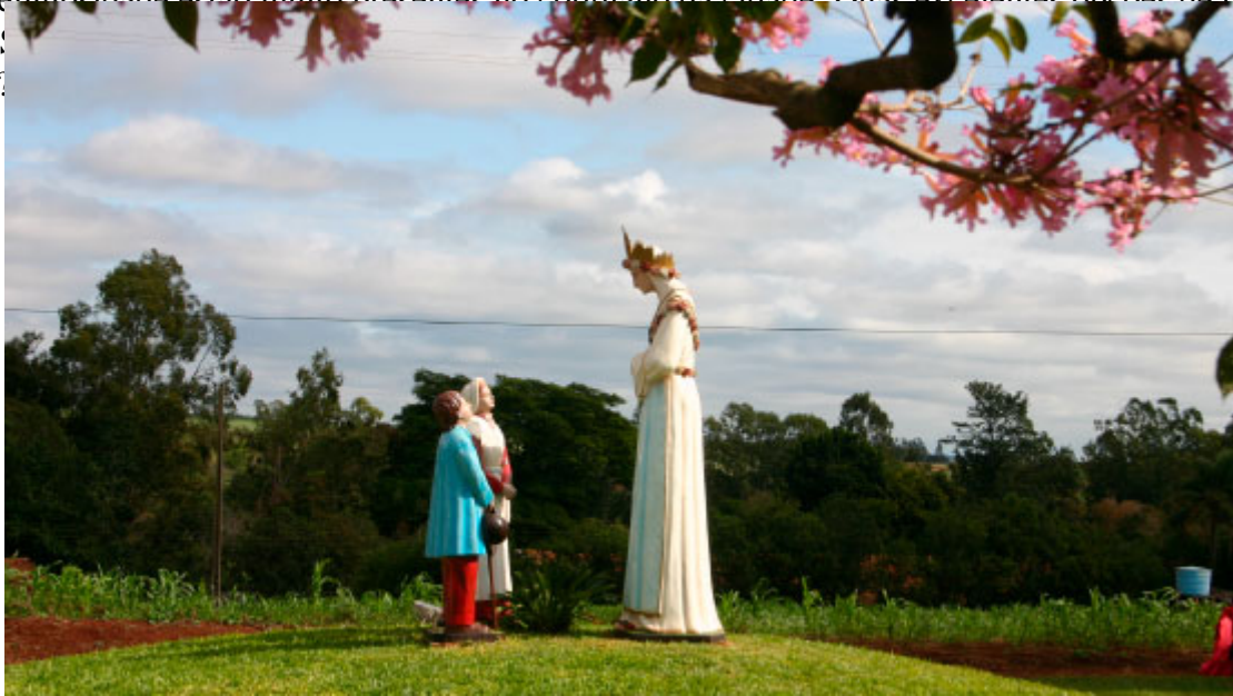
Santuário Nossa Senhora da Salette

Fé e religiosidade estão muito presentes no cotidiano da cidade. Duas excelentes opções de turismo religioso são o Santuário Nossa Senhora da Salette e o Santuário São Vicente Pallotti.?????