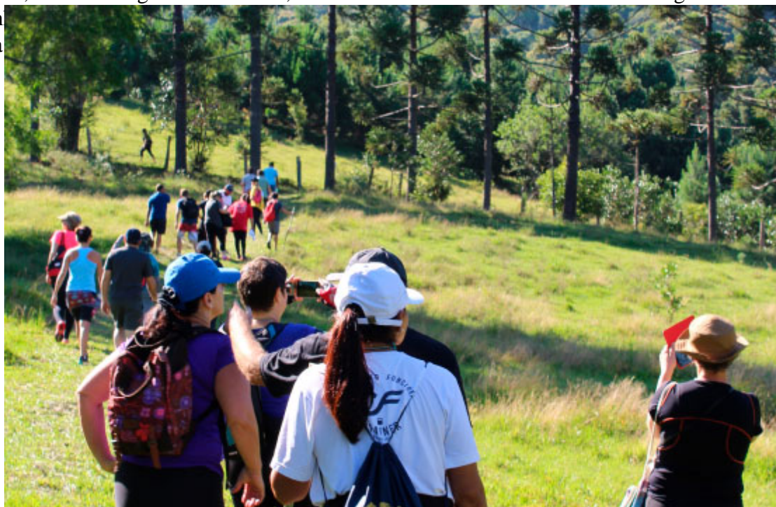
Caminhada da Natureza - Circuito Orgânicos da Serra

Atualmente existem quatro roteiros de Caminhadas da Natureza em Tijucas do Sul: Circuito Cachoeiras do Saltinho, Circuito Orgânicos da Serra, Caminho dos Ambrósios e Circuito do Cogumelo Champignon. As caminhadas são realizadas em contato com a natureza.