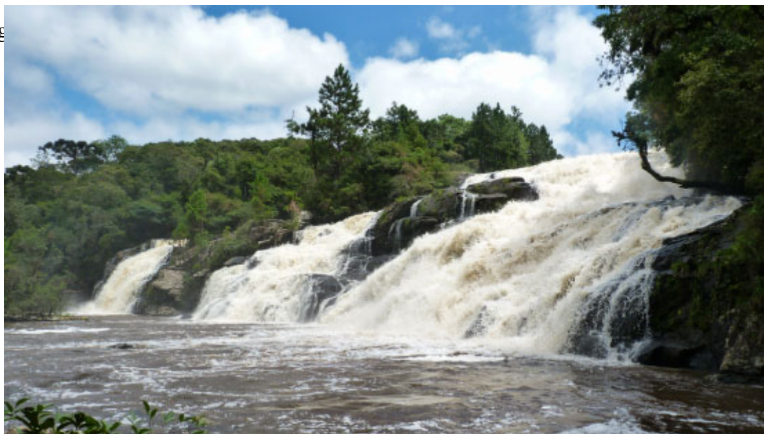
Cachoeira Rio da Várzea