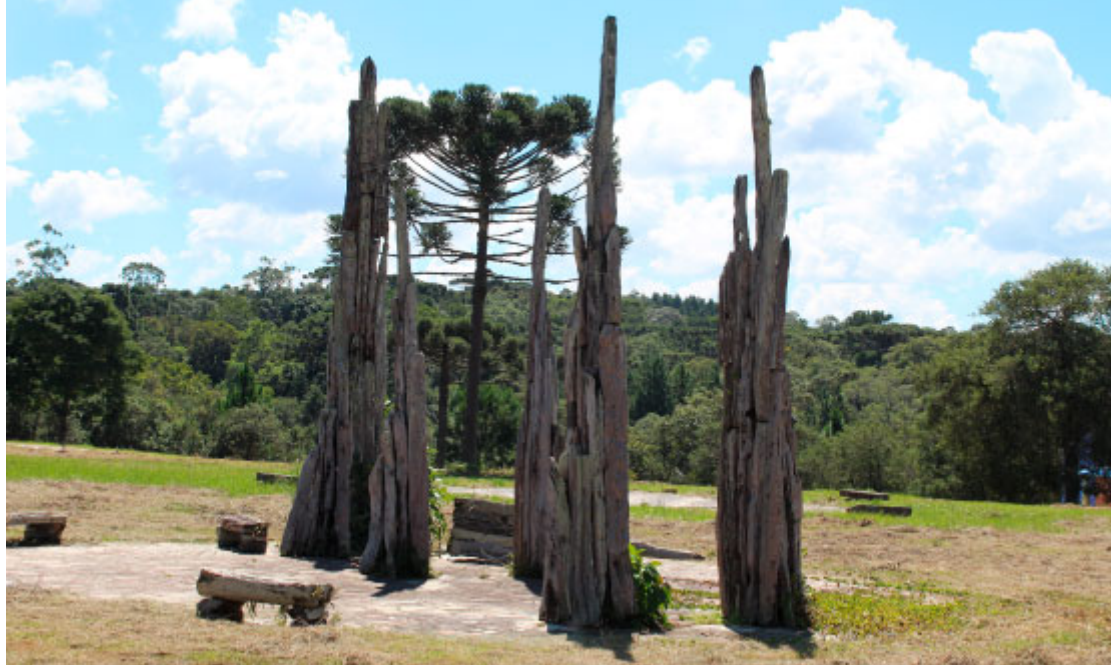
Obra de Sergius Erdelyi - Foto: Departamento de Turismo de Tijucas do Sul