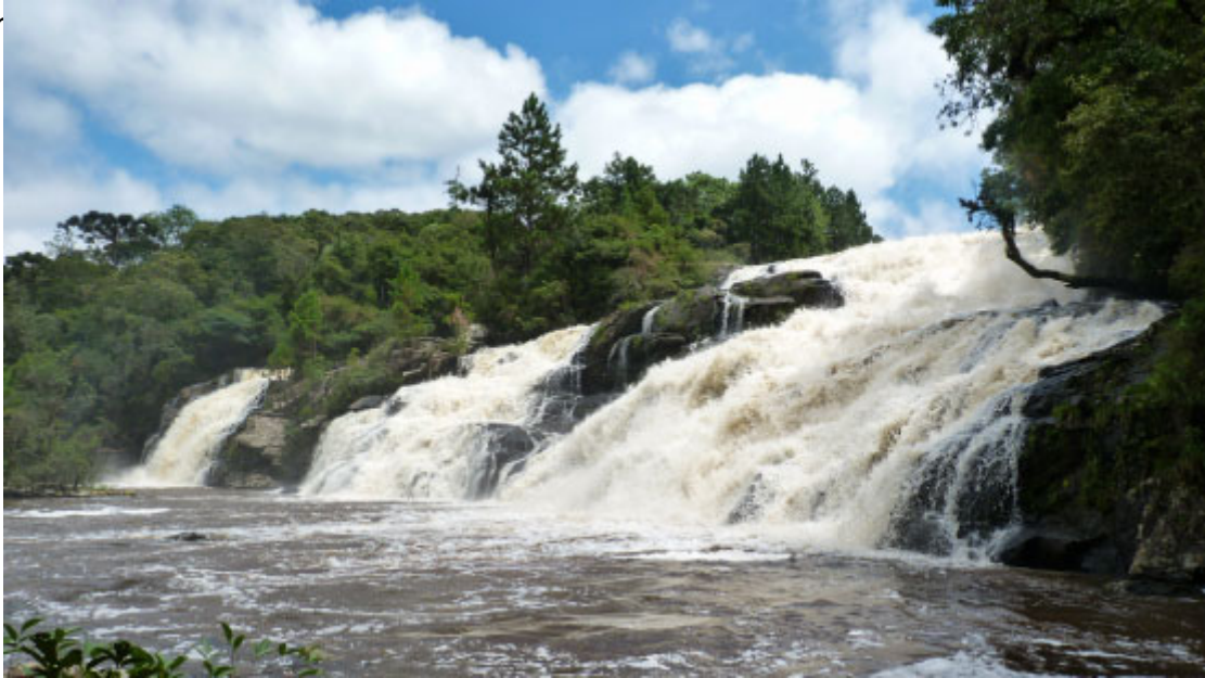
Cachoeira Rio da Várzea

A grande beleza da região com as nascentes do Rio Negro e do Rio da Várzea, a existência de diversas cachoeiras, serras, vales e represas, o clima e a paisagem subtr