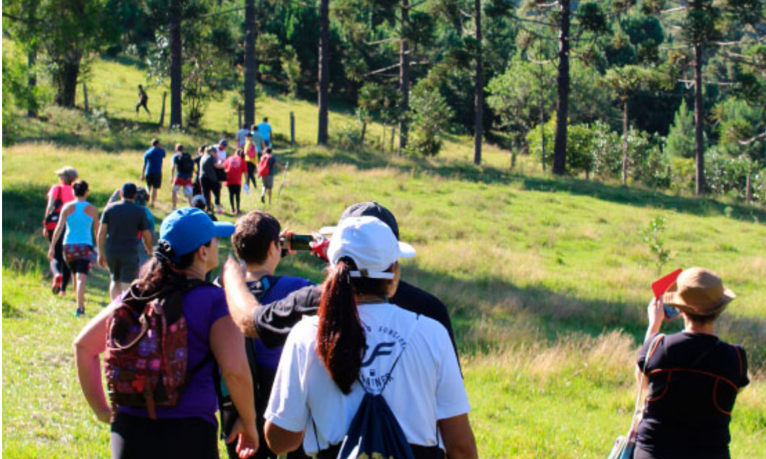
Caminhada da Natureza - Circuito Orgânicos da Serra