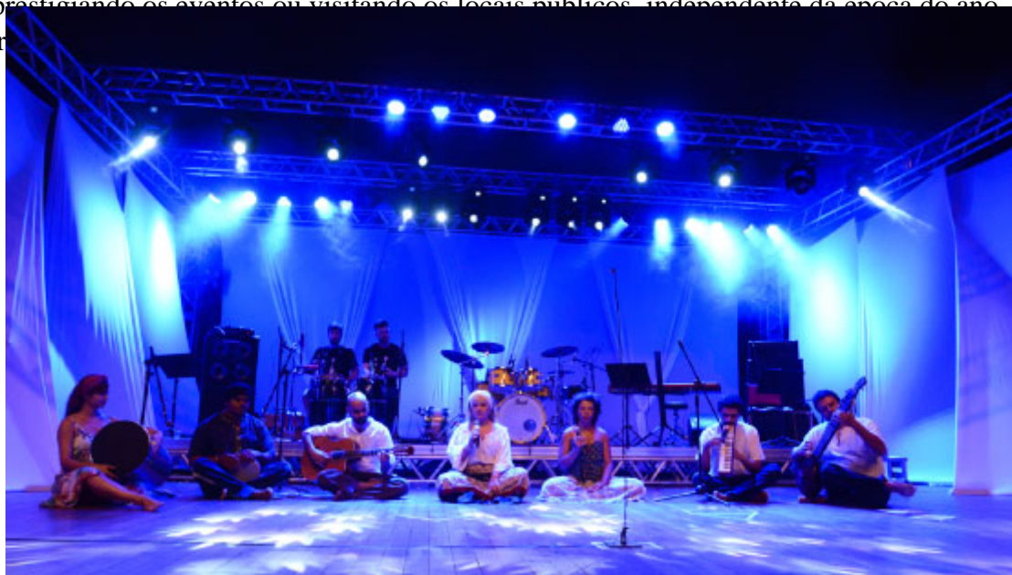
FEMUP - Festival de Música e Poesia - Foto: Prefeitura de Paranaíba

Seja prestigiando os eventos ou visitando os locais públicos, independente da época do ano, o turista que visitar