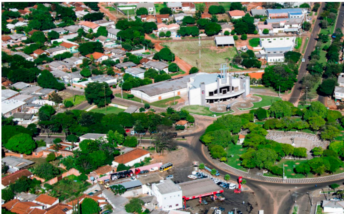
Rotatória Jardim São Jorge