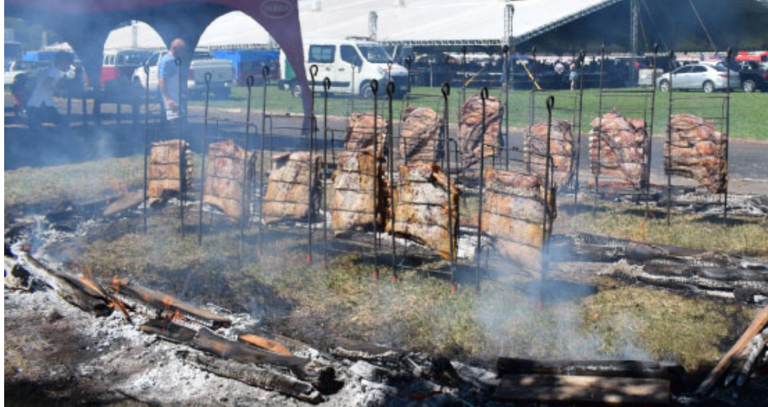
Sede do Sabor