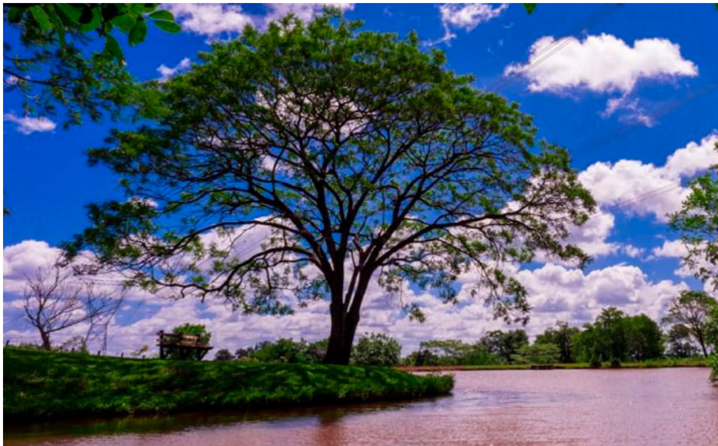
Pousada Mini Fazendinha