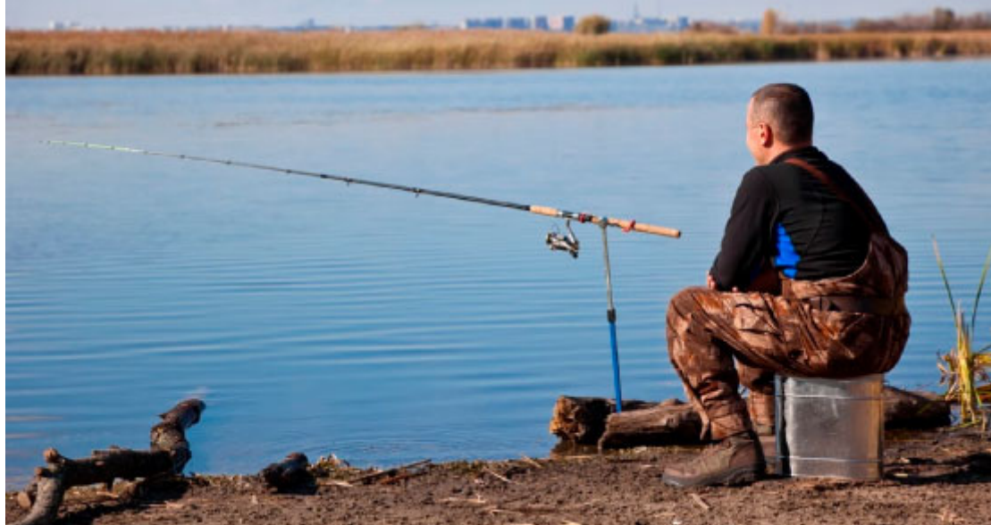
Pesca no Lago de Itaipu