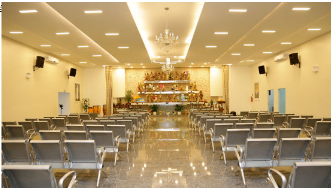
Santuário Reino de Baluaê