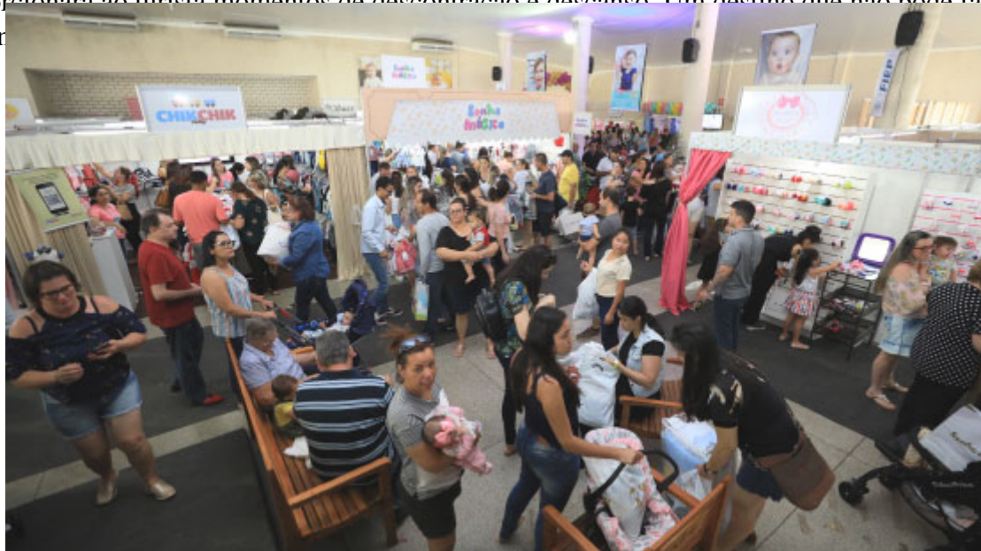
Feira Moda Bebê

Seja visitando os templos religiosos, as belezas naturais ou os eventos da cidade, Terra Roxa com certeza proporcionará ao turista momentos de descontração e descanso. Um destino que não pode faltar no roteiro de viagem.