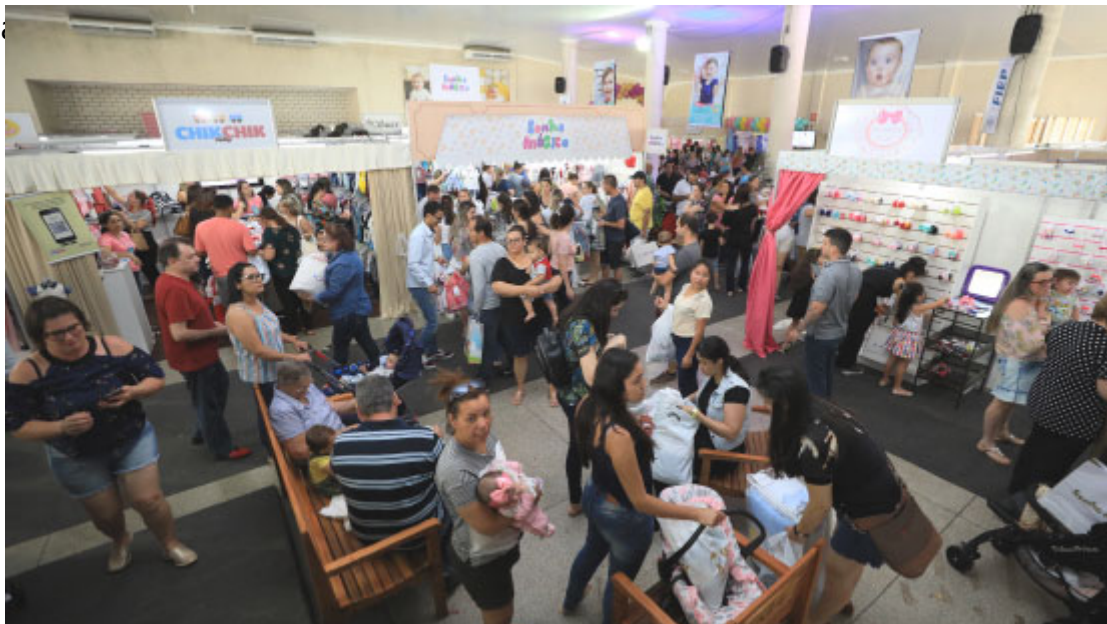
Feira Moda Bebê

Seja visitando os templos religiosos, as belezas naturais ou os eventos da cidade, Terra Roxa com certeza proporcionará ao turista momentos de descontração e desc