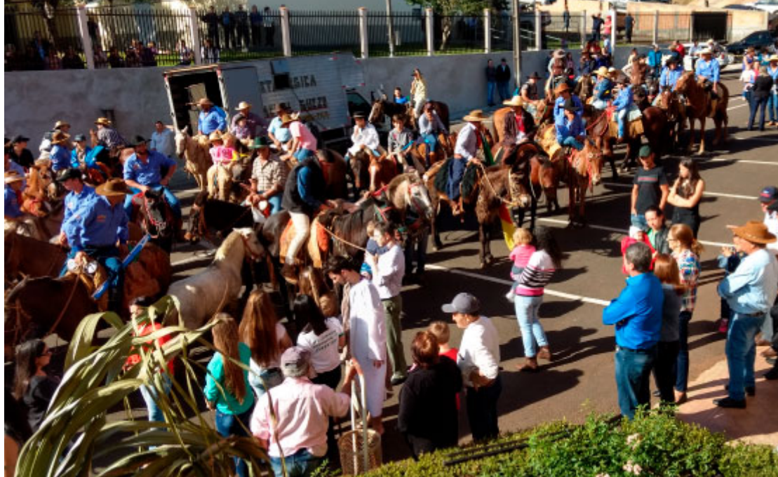
Cavalgada da Festa de São João Batista