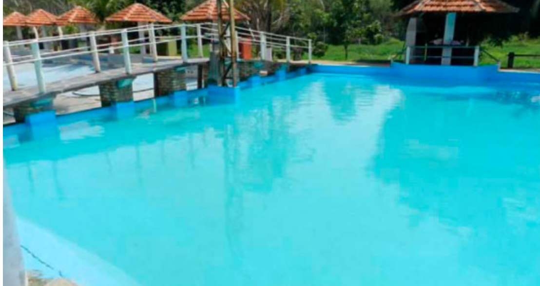
Hotel Fazenda Decolores