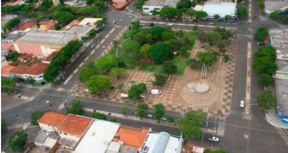
Praça da República