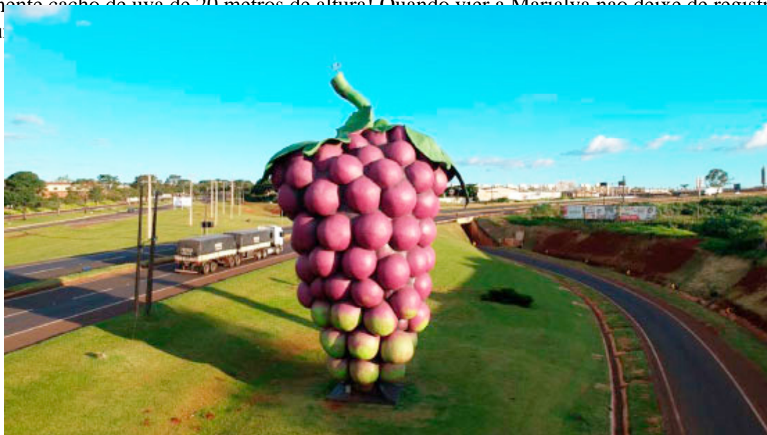
Monumento Cacho de Uva - Foto: Prefeitura de Marialva

Para simbolizar o título de Capital da Uva Fina, a cidade ergueu um monumento na entrada da cidade: um imponente cacho de uva de 20 metros de altura! Quando vier a Marialva não deixe de registrar o momento. Tire u