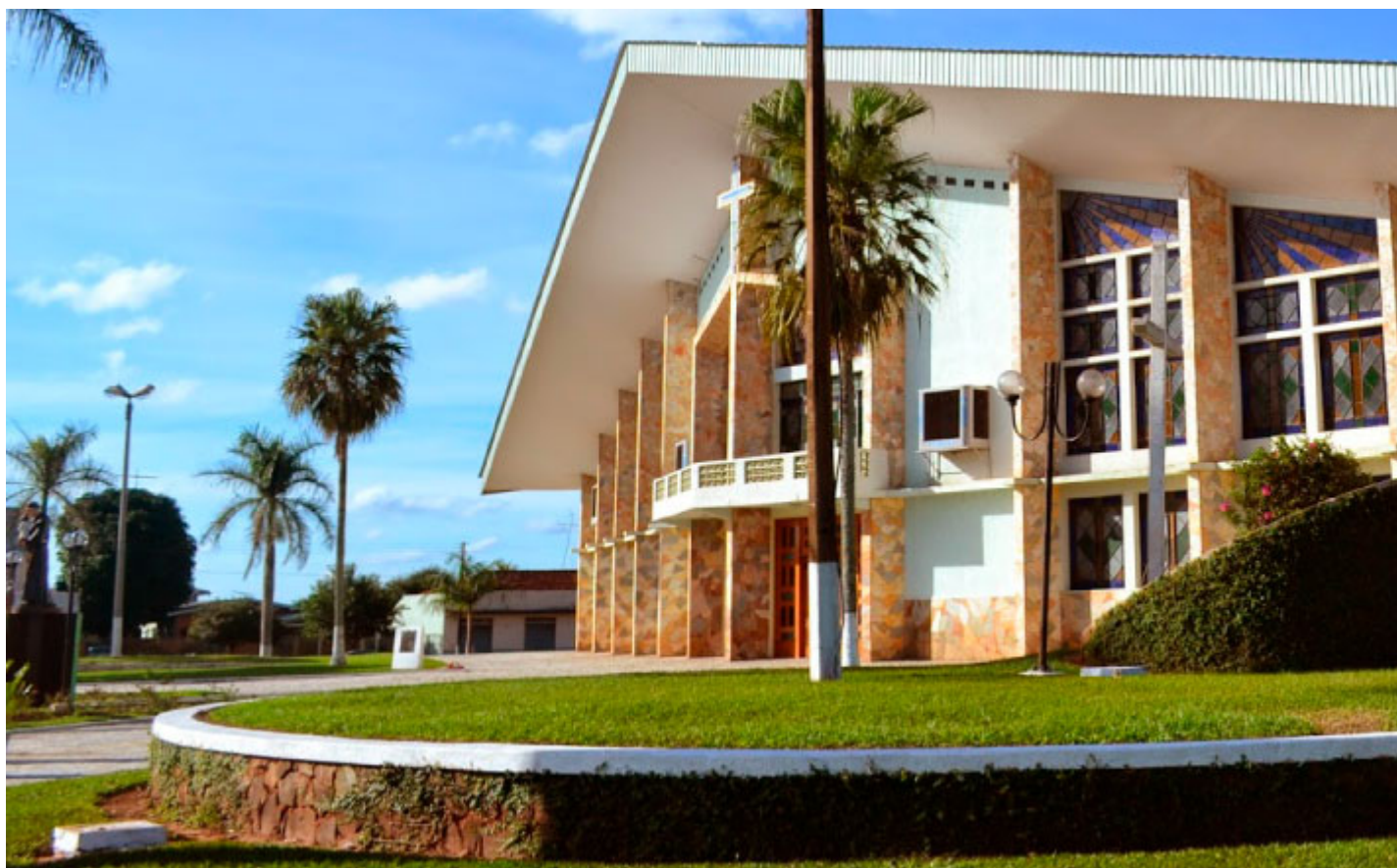
Igreja Matriz Santo Antônio - Foto: Prefeitura de Araruna