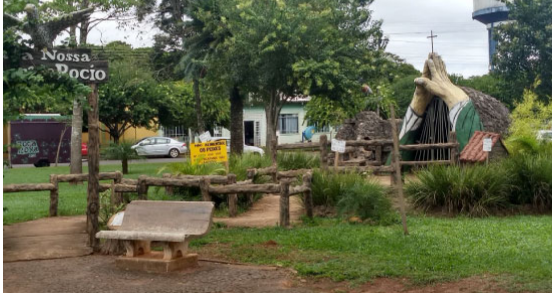
Praça Central - Foto: Prefeitura de Araruna