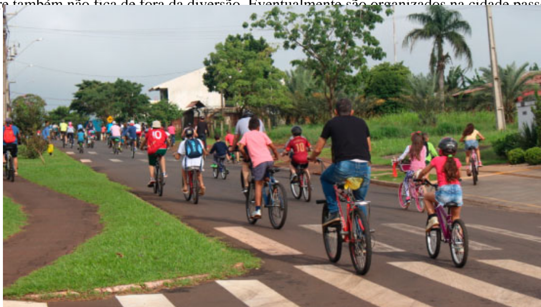
Passeio Ciclístico - Foto: Assessoria de Comunicação / Prefeitura de Medianeira

Os bailes de salão são tradicionais nas comunidades de Medianeira, mas o turista que prefere atividades ao ar livre também não fica de fora da diversão. Eventualmente são organizados na cidade passeios na natureza, como