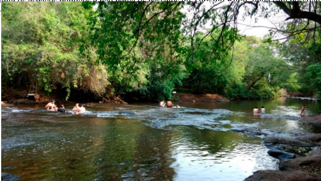
Recanto Olivo

Seja na cidade ou no campo, Medianeira proporciona ao turista momentos de cultura, descontração e lazer. Aproveite os espaços públicos e não perca os passeios de Turismo Rural, onde será possível vivenciar a vida no campo.