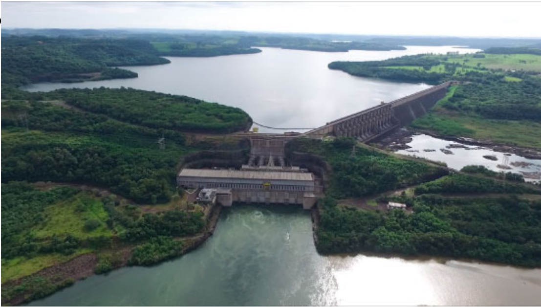
Usina de Salto Caxias - Foto: Prefeitura de Nova Prata do Iguaçu