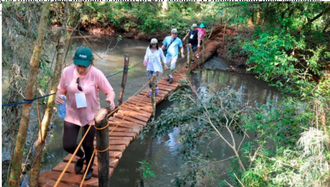
Caminhada - Foto: Prefeitura de Luiziana

O Parque Lago Azul tem duas trilhas: a Peroba e de Aventura. A primeira tem trajeto suave de 3.850 metros entre a mata fechada, áreas abertas, cerrado, passando por pequena cascata, lago e viveiro de mudas. A trilha Aventura tem extensão de 3,2 mil metros e, só pode ser feita por maiores de 14 anos e em dias de tempo seco, quando o trajeto não oferece riscos. A caminhada exige um pouco mais do visitante, que passará por trecho de floresta e pela margem e dentro do Rio Mourão. O trajeto inclui duas cachoeiras – os saltos Belo e São João.