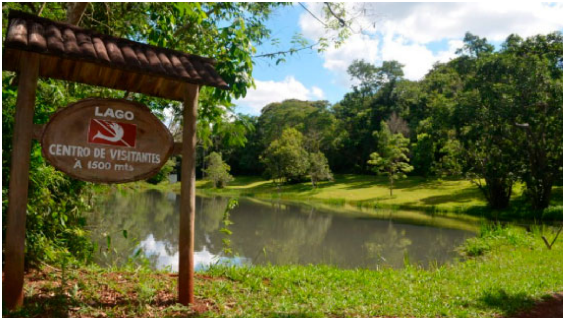
Parque Estadual Lago Azul

Mantida em parceria com Campo Mourão, o Parque Estadual Lago Azul tem como afluentes os rios de Luiziana, além das águas represadas pela Usina Mourão. O local recebe diariamente centenas de visitantes e oferece duas opções de trilhas, a Peroba e a Aventura. O segundo trajeto precisa de mais atenção na caminhada, por isso, é necessário contratar um guia.