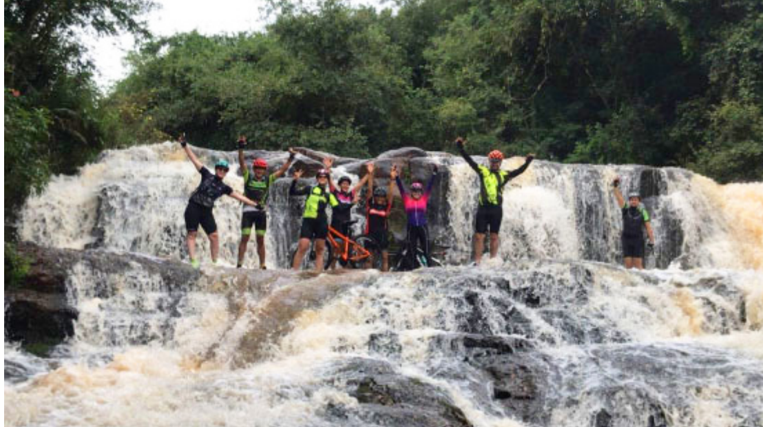
Cachoeira Rio Sem Passo