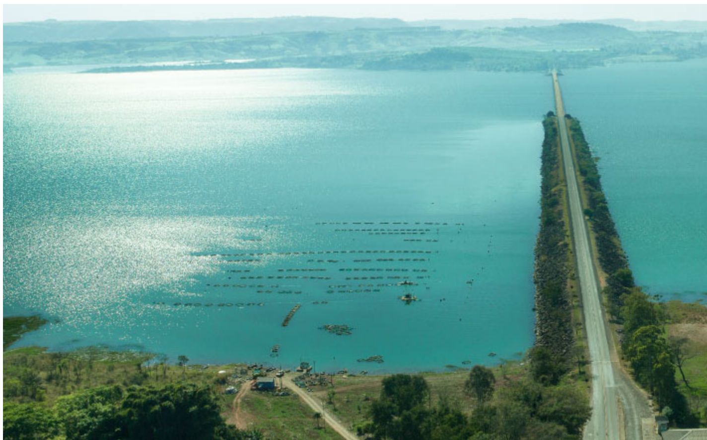
Aterro e Ponte Interestadual