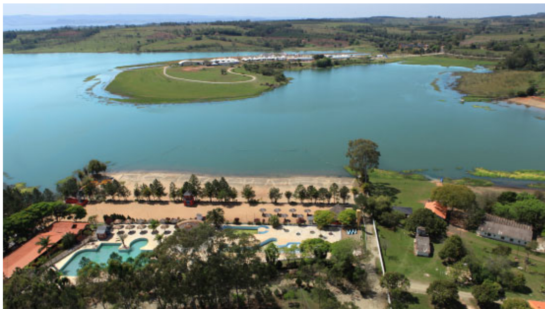
Clube Vale dos Sonhos e Ilha do Ponciano