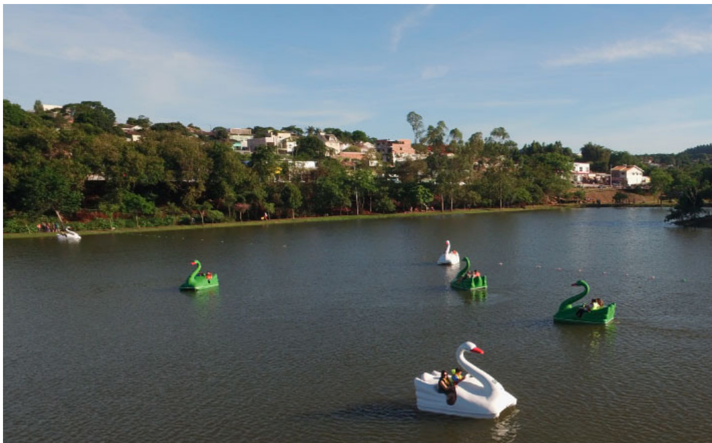
Parque Ambiental Jardim Botânico - Foto: Prefeitura de Ivaiporã