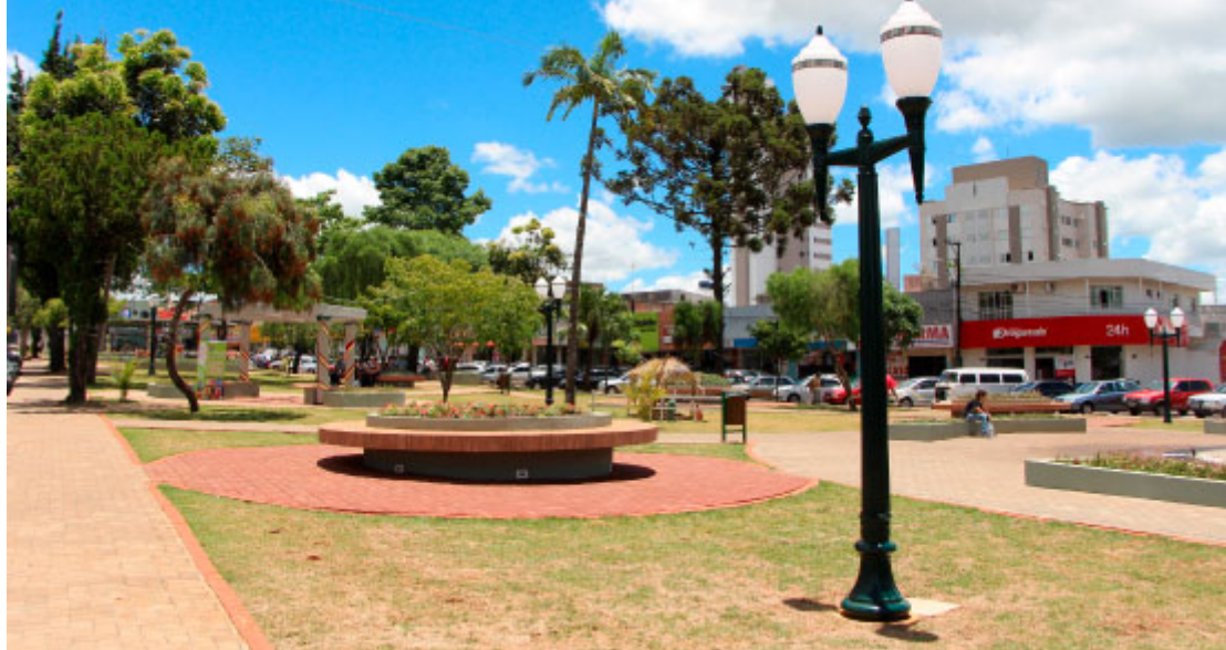
Praças Preservadas