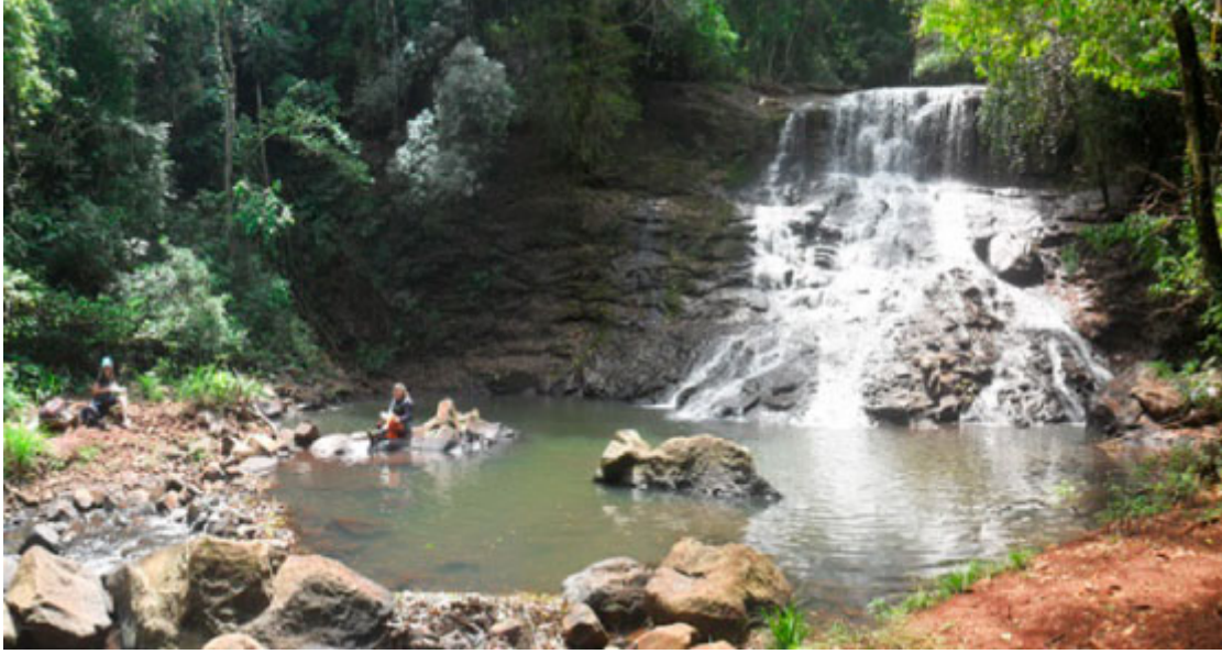
Cachu Portelinha