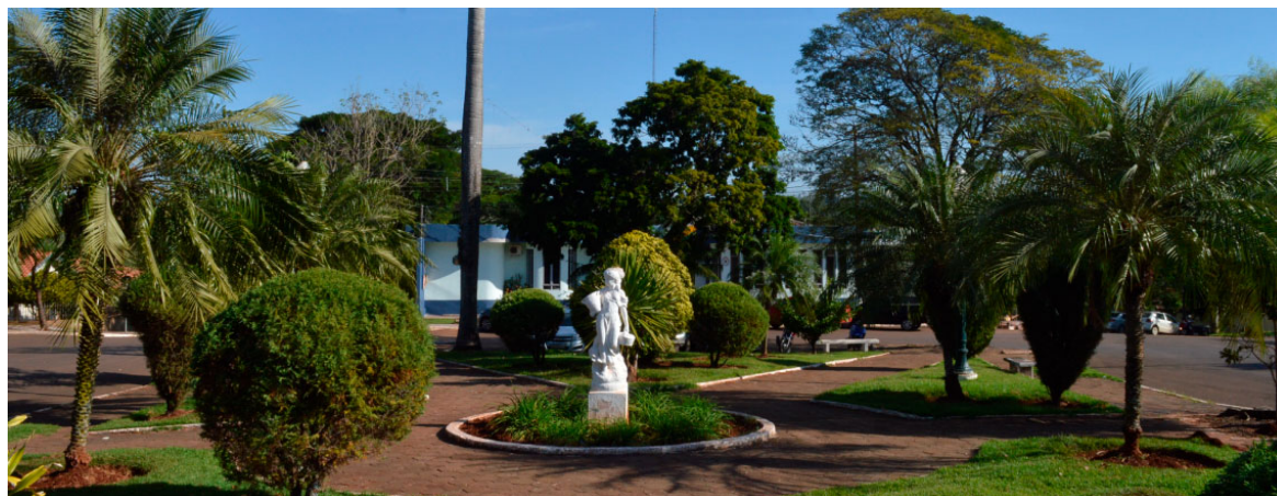
Praça Solange Marques