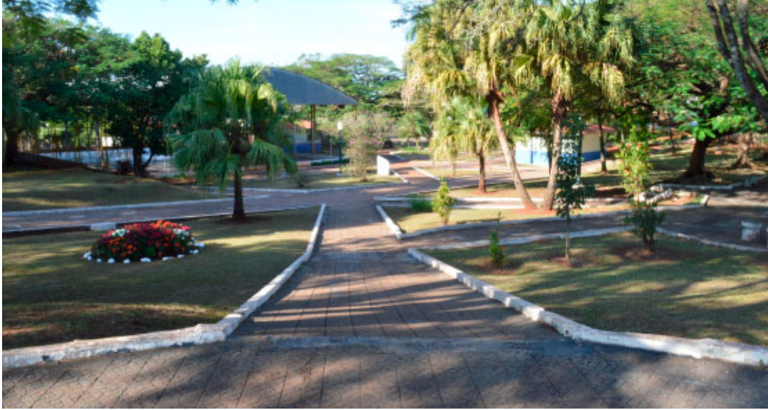
Praça Gentil José Soares