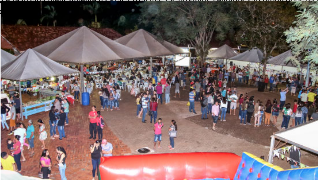
Feira da Terra

A feira é realizada mensalmente na Praça Brasília. Os produtos vendidos são produzidos na cidade e no interior