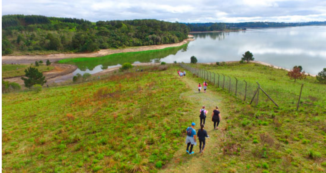
Caminhada Ecológica