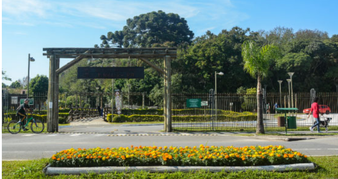
Bosque Municipal