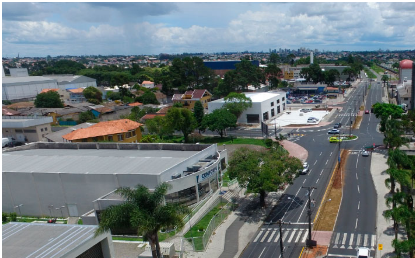
Avenida Iraí