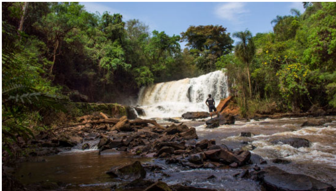
Salto Rio Claro - Caminhos de Peabiru - Foto: Leandro Gonçalves Silva