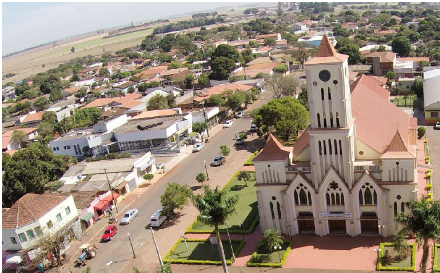
Igreja Matriz