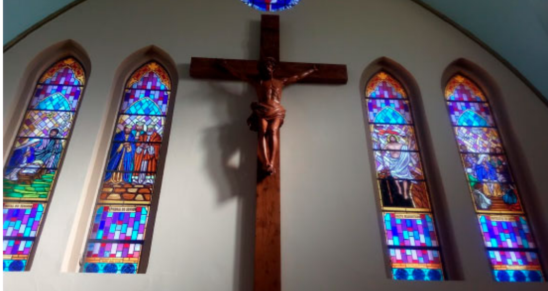
Esculturas e Vitrais na Igreja Matriz - Foto: Prefeitura do Município de Peabiru