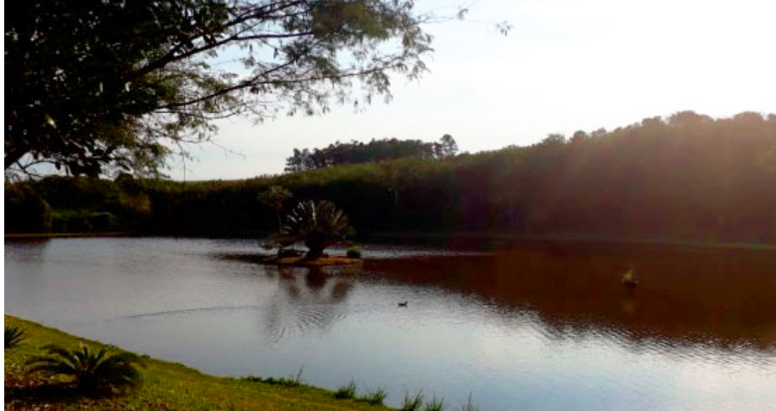
Lagoa Prateada