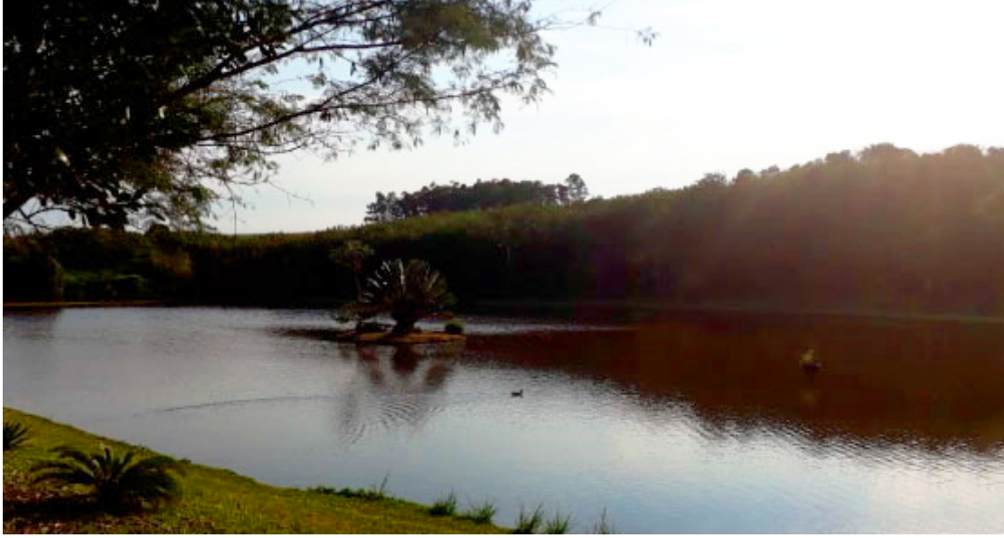
Lagoa Prateada