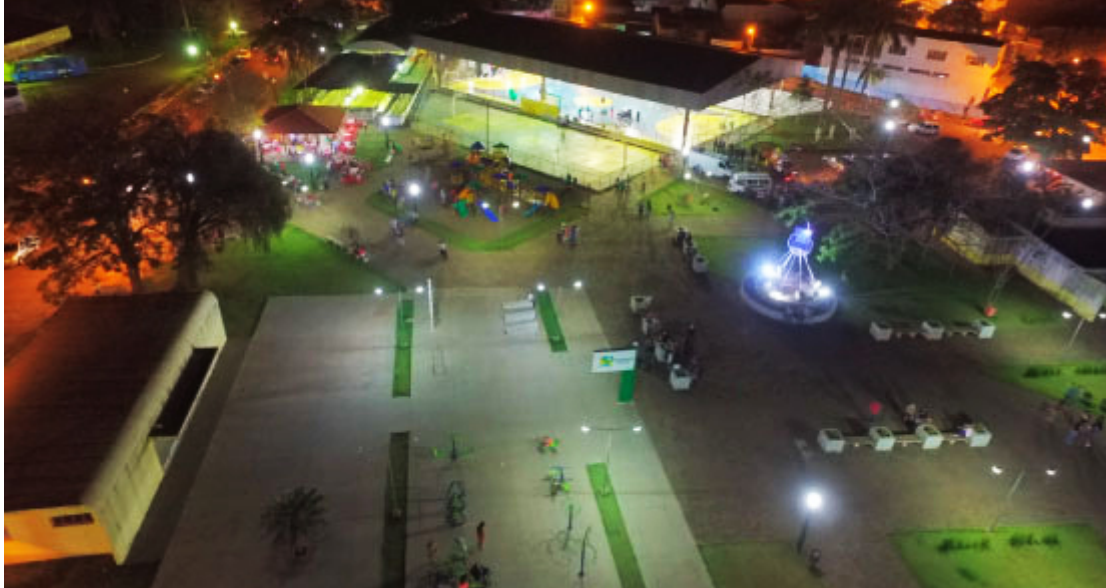
Praça Central - Foto: Prefeitura de São João do Ivaí