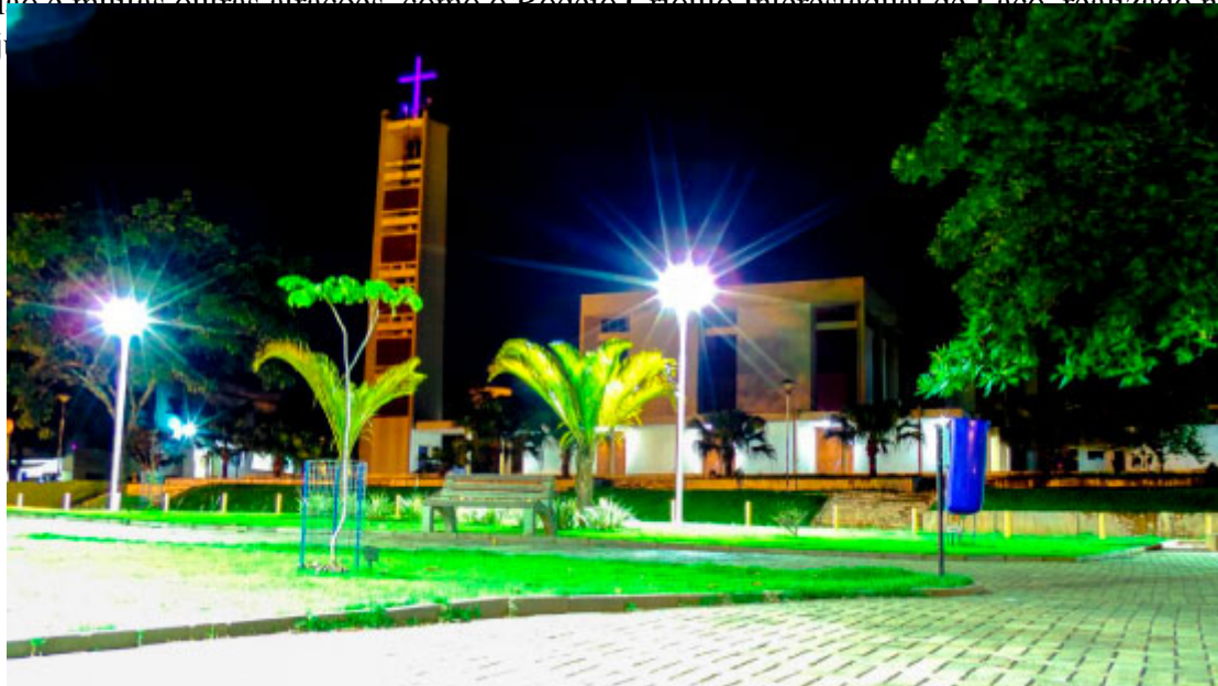
Praça da Igreja Matriz - Foto: Prefeitura de Cidade Gaúcha

No mês de junho, a Cidade Gaúcha realiza a Festa da Leitoa Desossada, que tem o prato típico como anfitrião e muitas outras atrações, como o Pedeio Crioulo Interestadual de Leão, realizado no CTG Sepé Tiarajé. ??