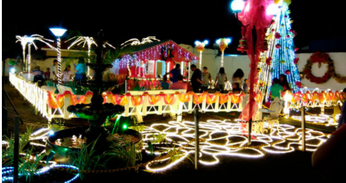
Casa do Papai Noel