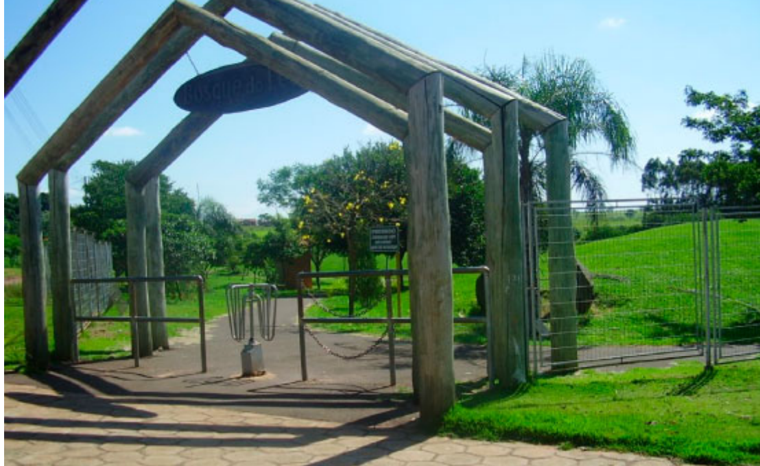
Bosque do Leão