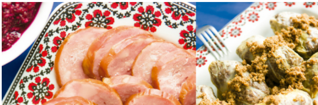
Cracóvia, Prudentópolis | Varéneke, Prudentópolis