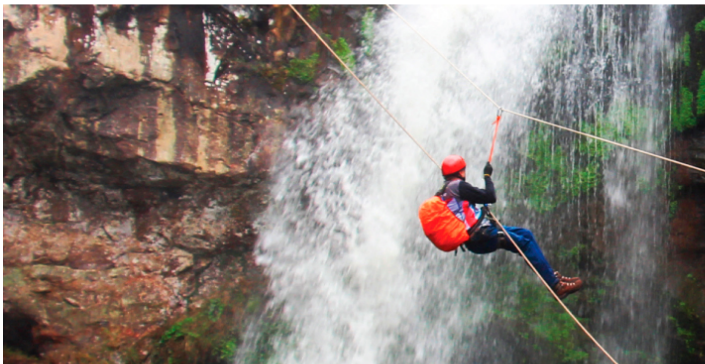
Canionismo, Salto das Pombas, Guarapuava