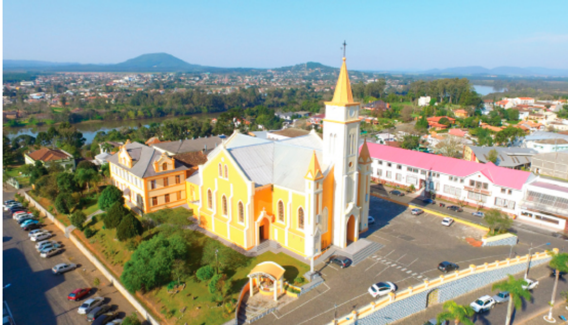
Igreja Matriz Nossa Senhora das Vitórias, União da Vitória