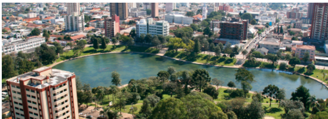
Lagoa das Lágrimas, Guarapuava