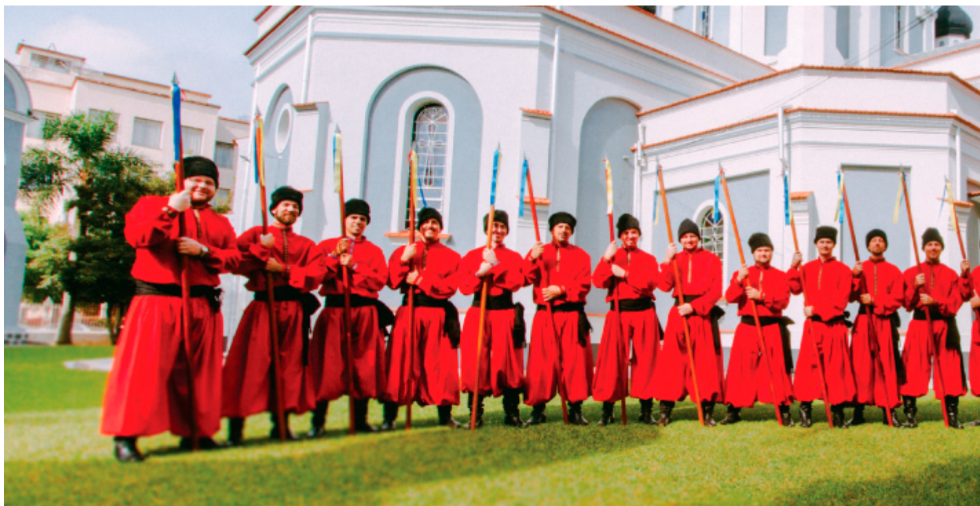
Cultura Ucraniana, Igreja de São Josafat, Prudentópolis