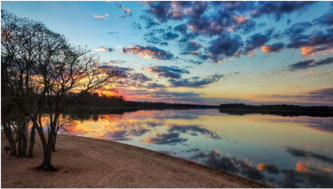
Praia Artificial