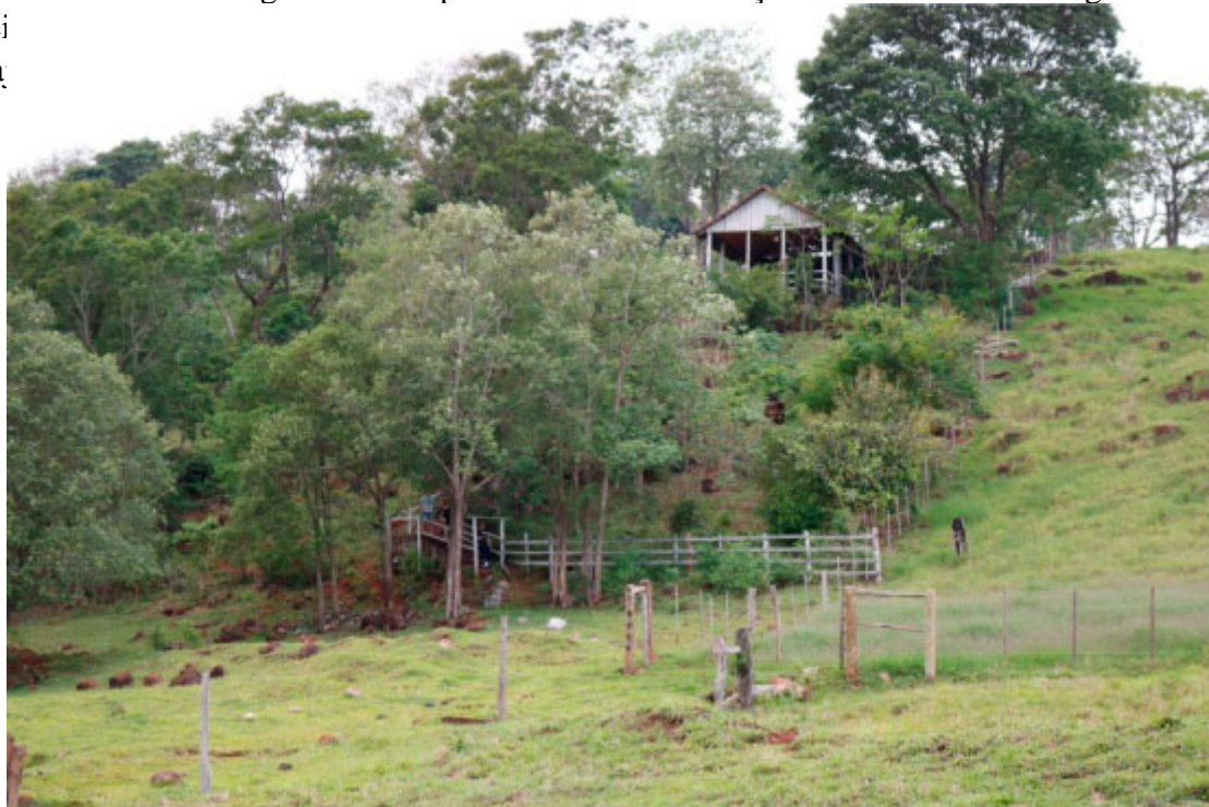
Comunidade Manto Sagrado

A história da cidade está ligada à ocupação social e econômica do Oeste do Paraná, onde migrantes do Norte e Sul se instalaram na região e se adaptaram às novas condições de clima e solo. Segundo os pioneiros, o primeiro grupo de viajantes chegou por um grupo de viajantes em 1850.