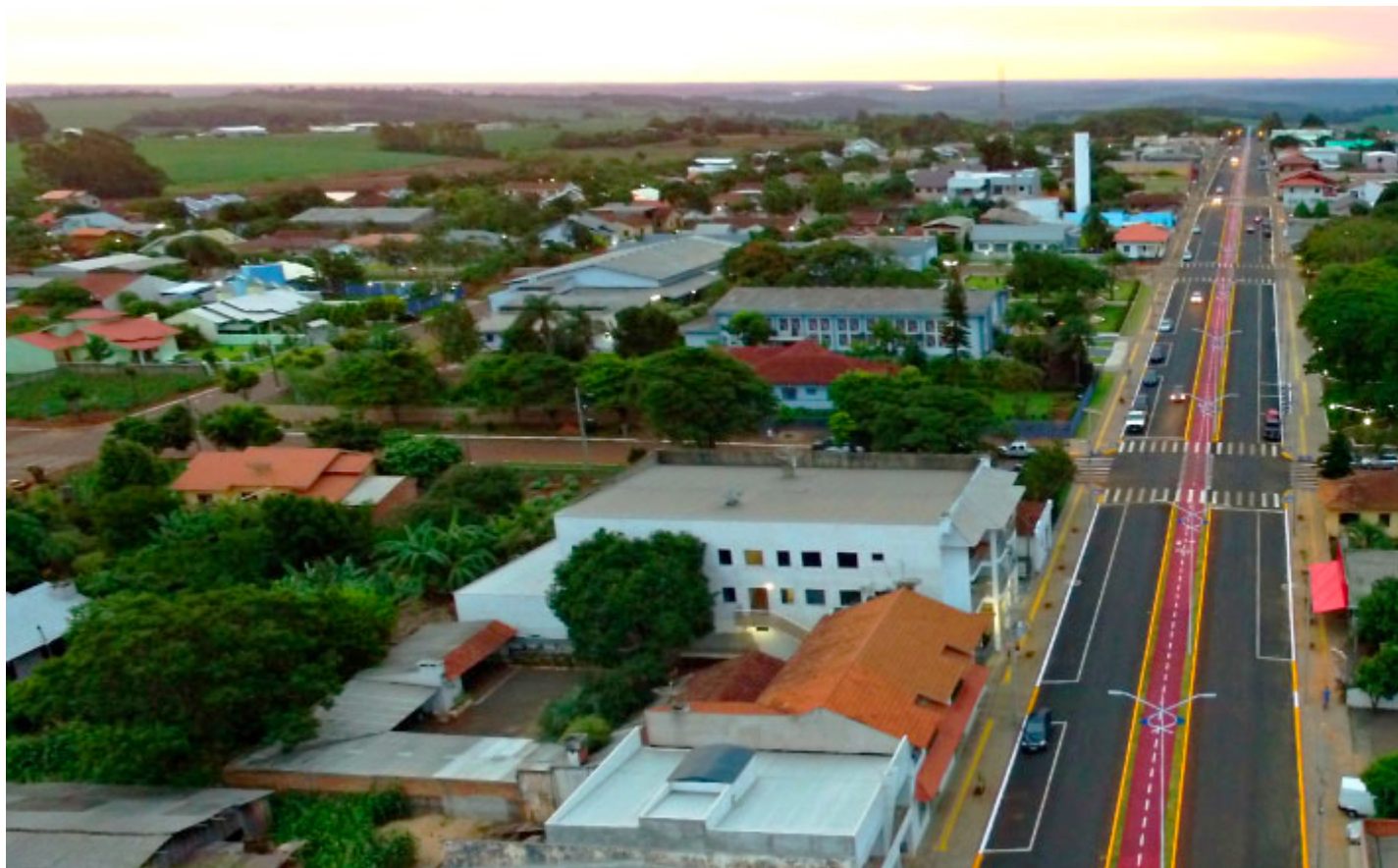
Avenida João XXIII