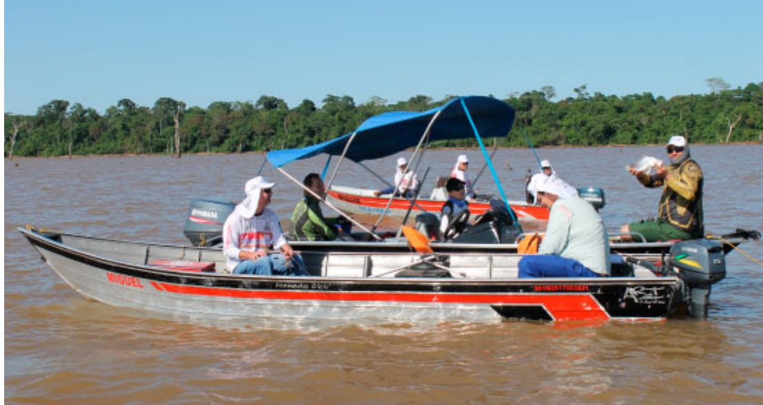
Torneio de Pesca