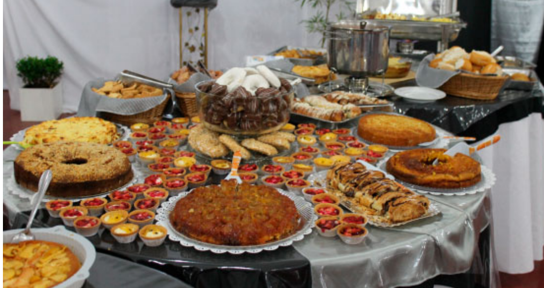
Café Colonial