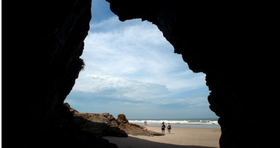
Gruta das Encantadas