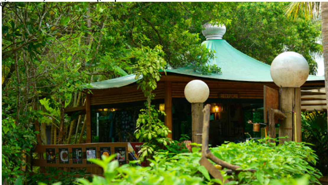
Praça de Alimentação

É claro que a gastronomia típica da ilha é frutos do mar. Lá você encontra vários restaurantes – e muitos deles são pousadas também. Aproveite o passeio para escolher um prato de peixe, camarão ou outra espécie que aprecie. Mas se você não curte muito frutos do mar, tem outras opções também – não deixe de aproveitar a culinária típica da ilha.