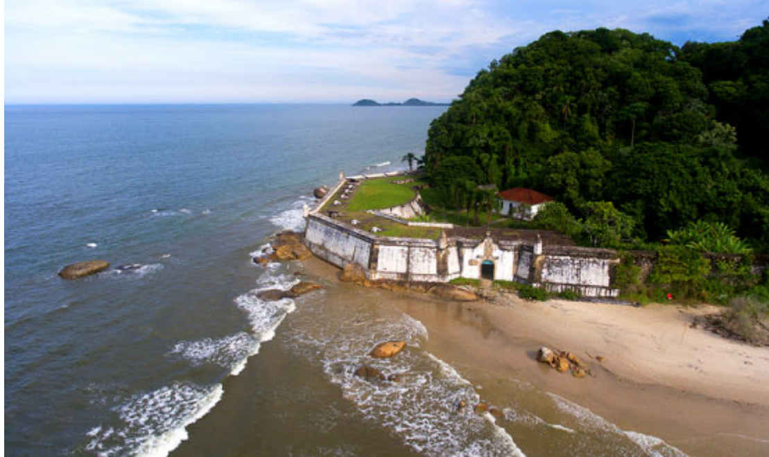
Fortaleza Nossa Senhora dos Prazeres