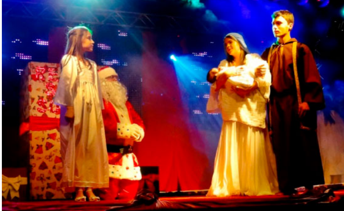
Natal Vida