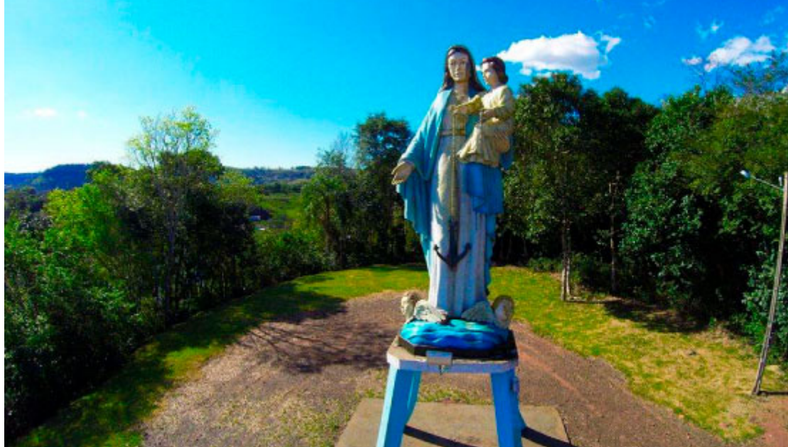
Nossa Senhora dos Navegantes - Foto: Alex Garcia / Prefeitura de Rio Bonito do Iguaçu