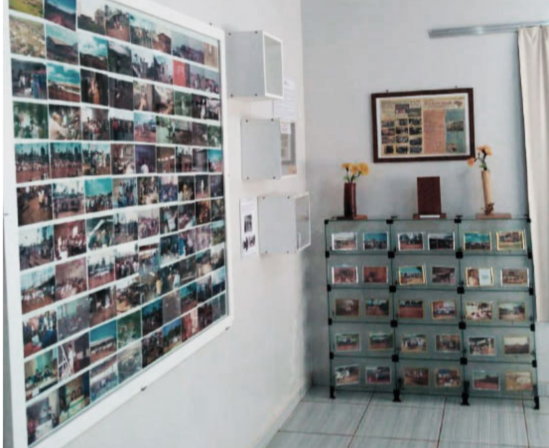
Centro da Memória Terra e Povo - Foto: Rudison Ladislau / Prefeitura de Rio Bonito do Iguçu