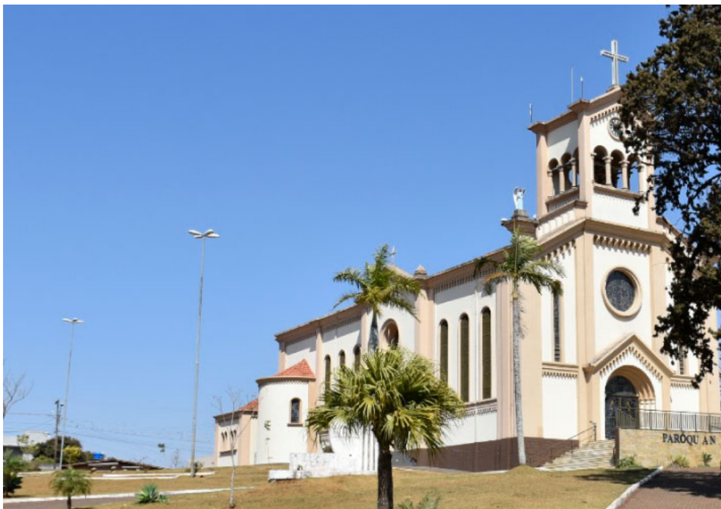
Igreja Matriz