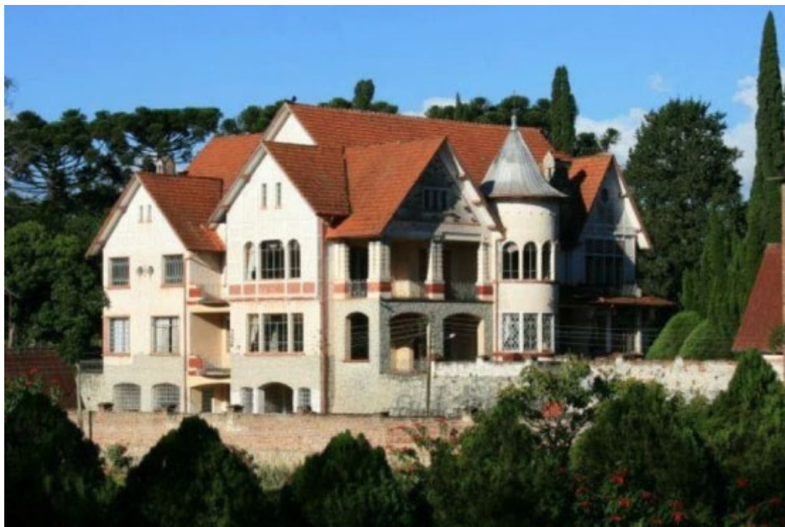
Castelo Eldorado