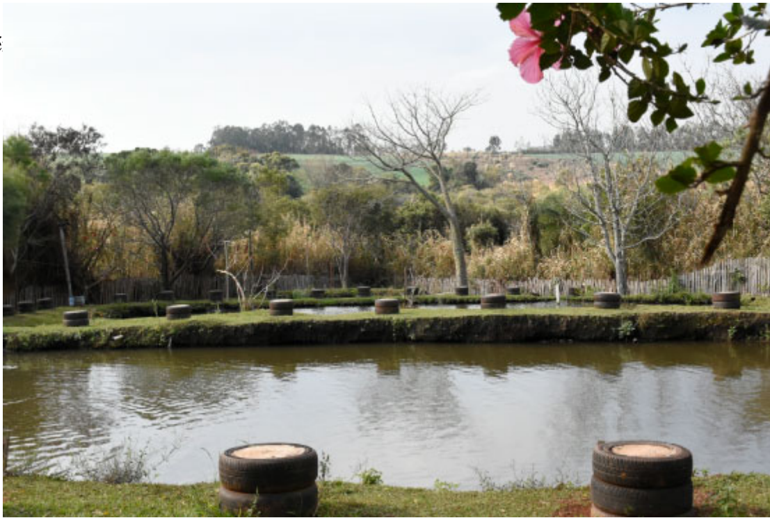
Pesque Pague