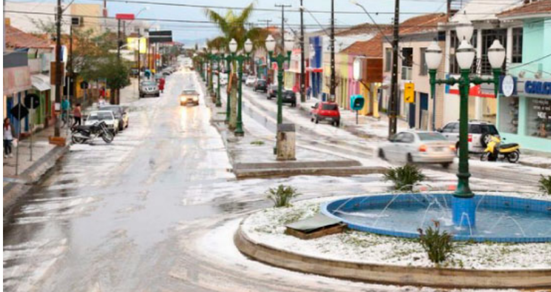
Avenida Sete de Setembro