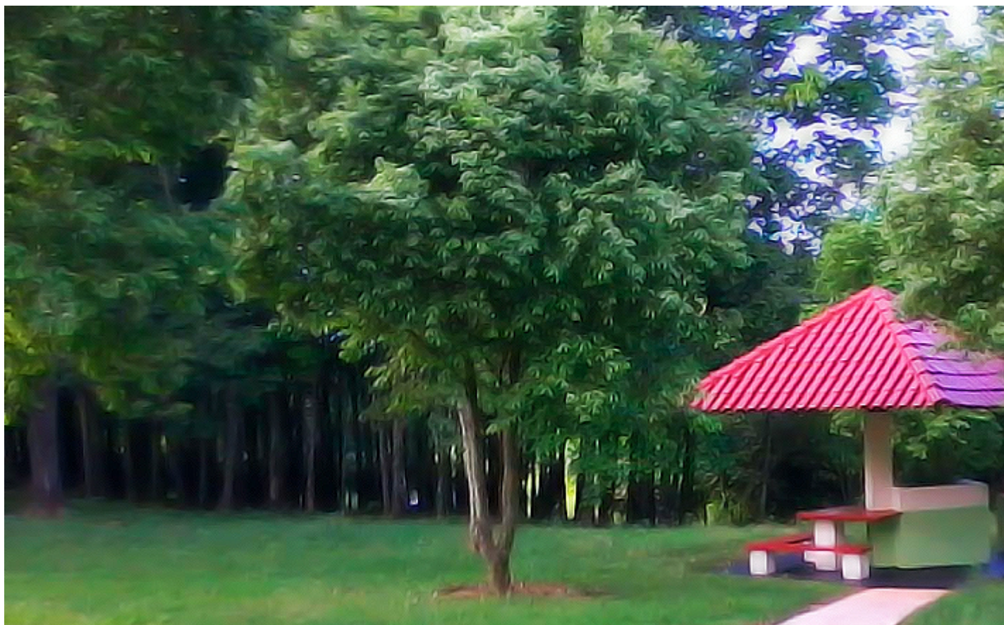
Parque Ecológico Primavera