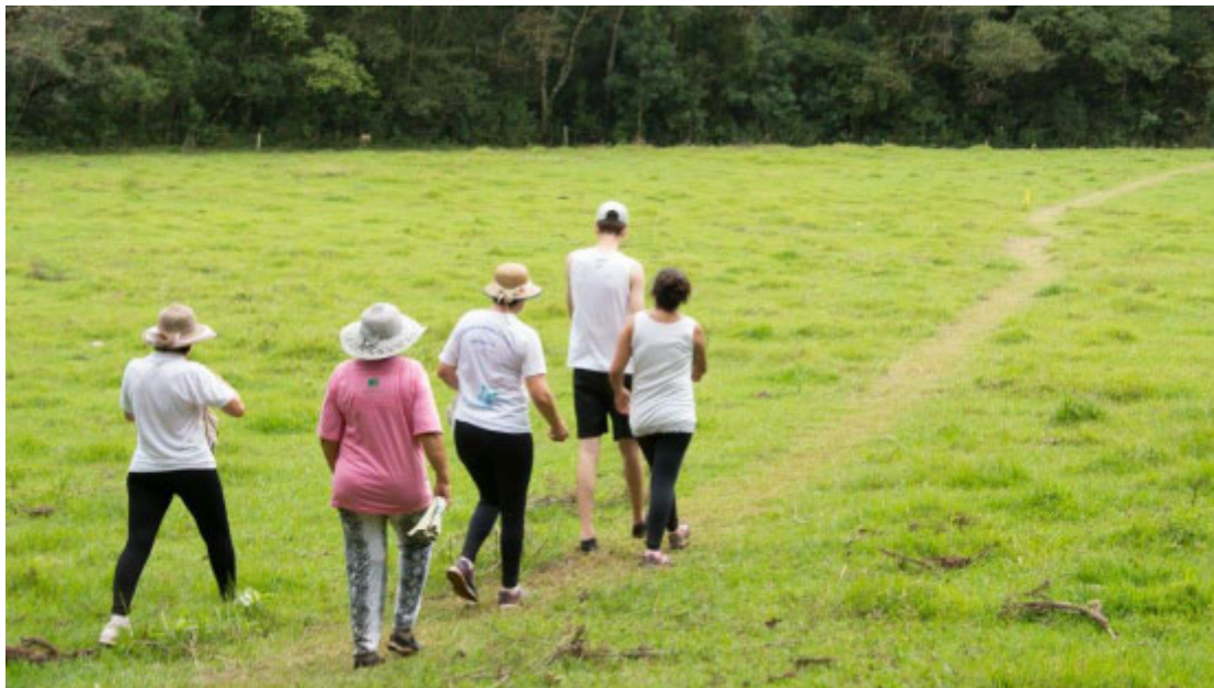
Caminhada na Natureza