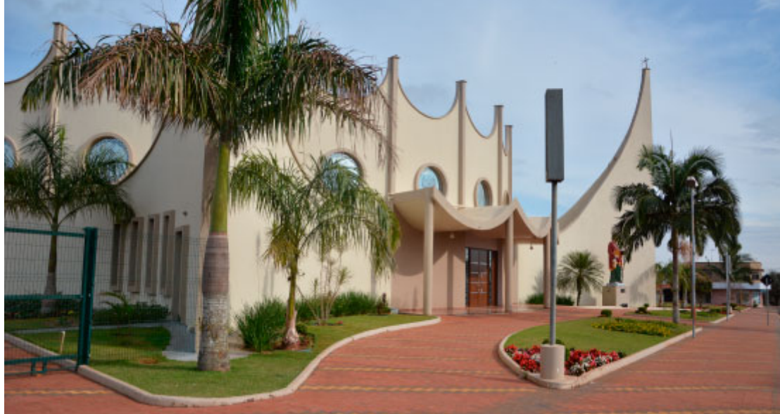
Igreja Matriz Paróquia São Judas Tadeu