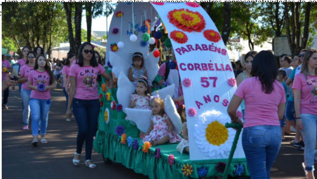
Desfile das Flores

Em comemoração ao aniversário de emancipação de Corbélia, o desfile cívico, conhecido como desfile das flores, tem participação de empresas, escolas, associações e outras representatividades da comunidade municipal.