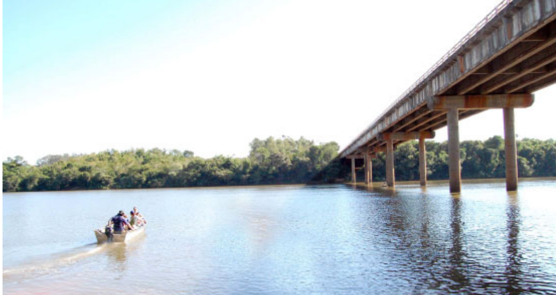
Rio Piquiri