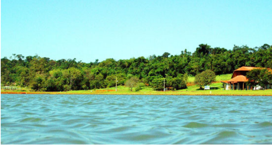
Horto Municipal - Foto: Prefeitura de Assis Chateaubriand