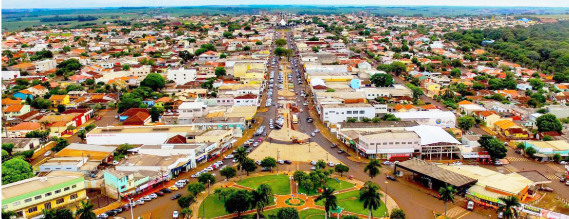
Avenida Tupãssi