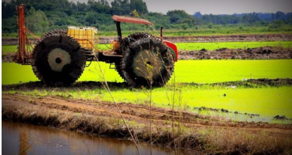
Arroz Irrigado - Foto: Claudiney Nery