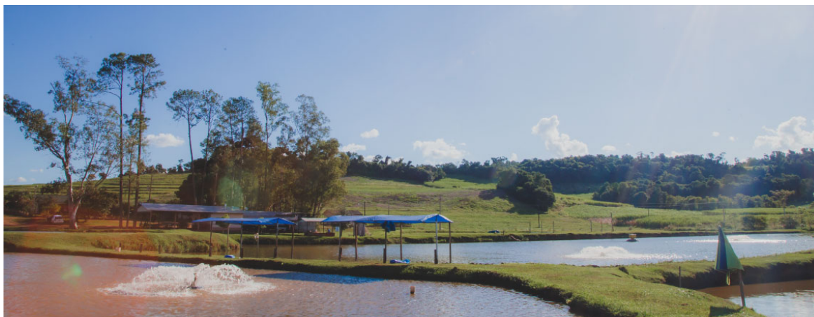
Pesque Pague