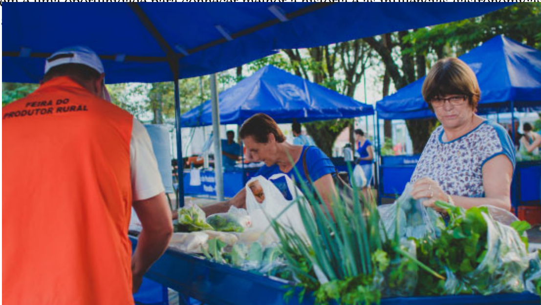
Feira do Produtor Rural

Também é uma oportunidade para conhecer melhor a história e as influências gastronômicas da cidade. Tem ainda