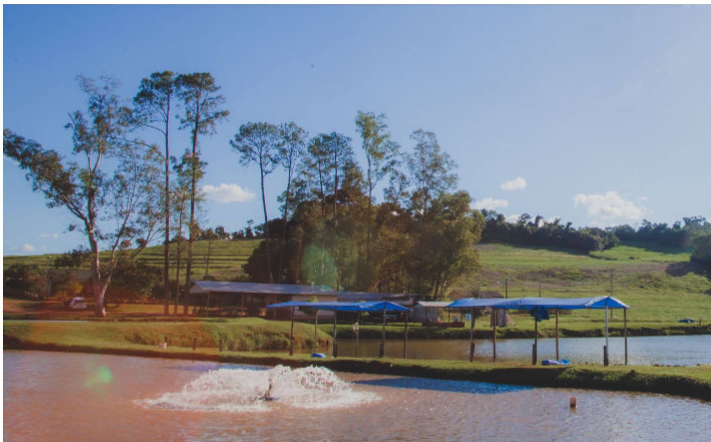
Pesque Pague