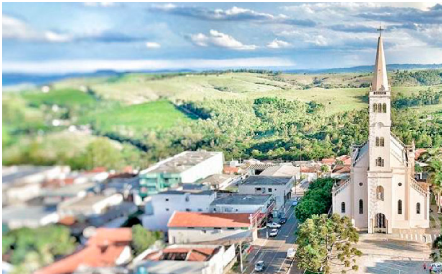
Santuário Sagrado Coração de Jesus