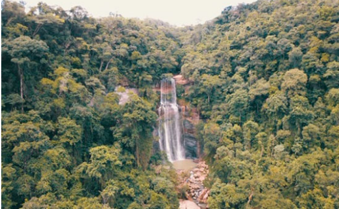
Cachoeira do Aristeu