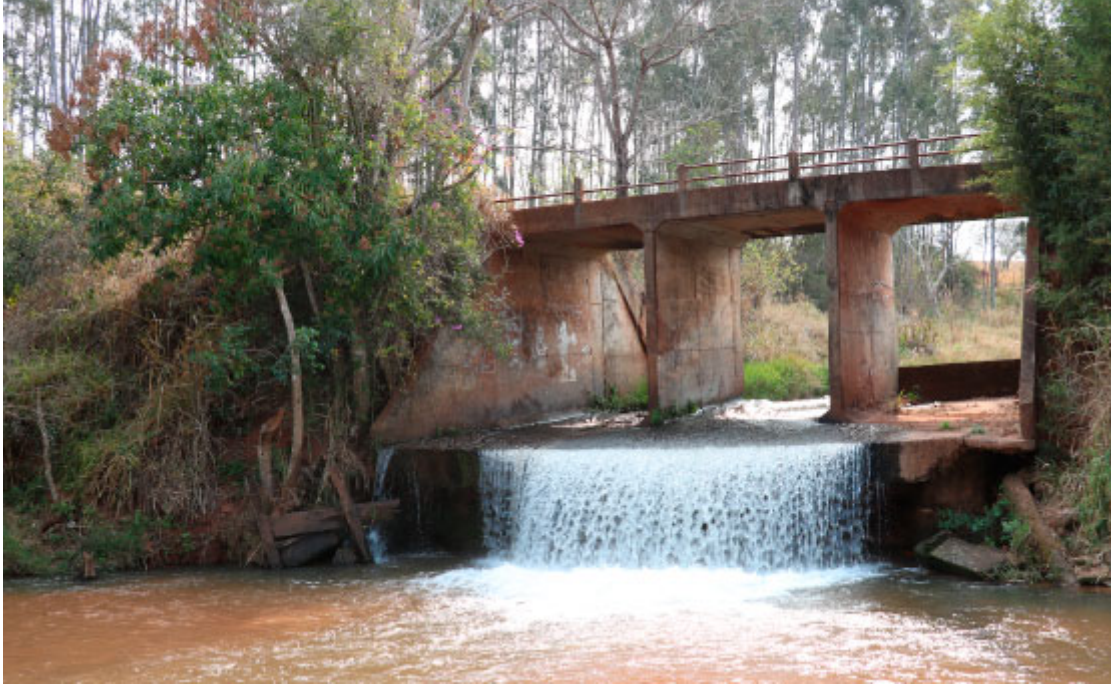
Cachoeira do Porongo