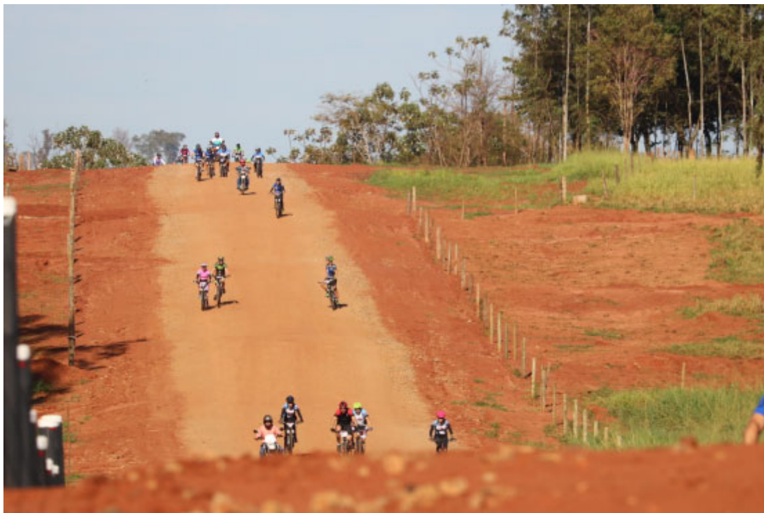
Circuito Internacional Vou de Bike