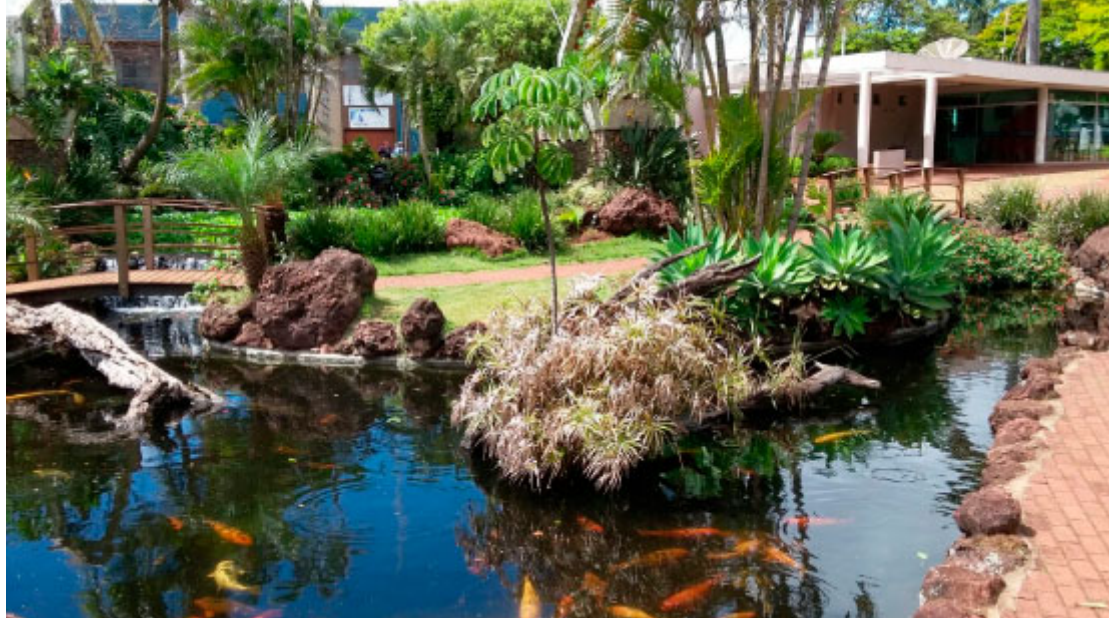
Lago Oásis