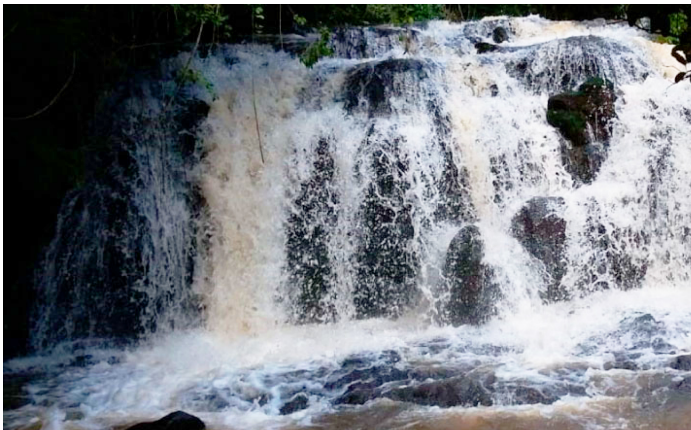
Cachoeira Refúgio Padre Palmiro Finato