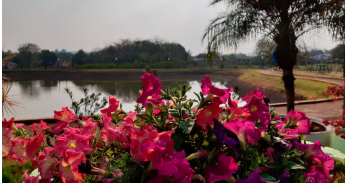
Lago Municipal