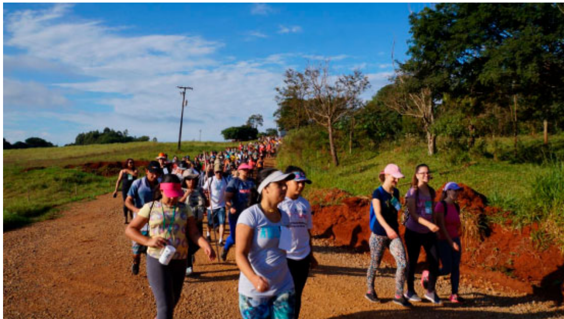
Caminhada na Natureza