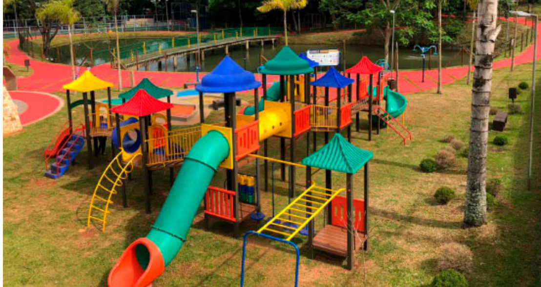
Playground Infantil e Lago do Bosque Municipal - Foto: Prefeitura de Terra Boa