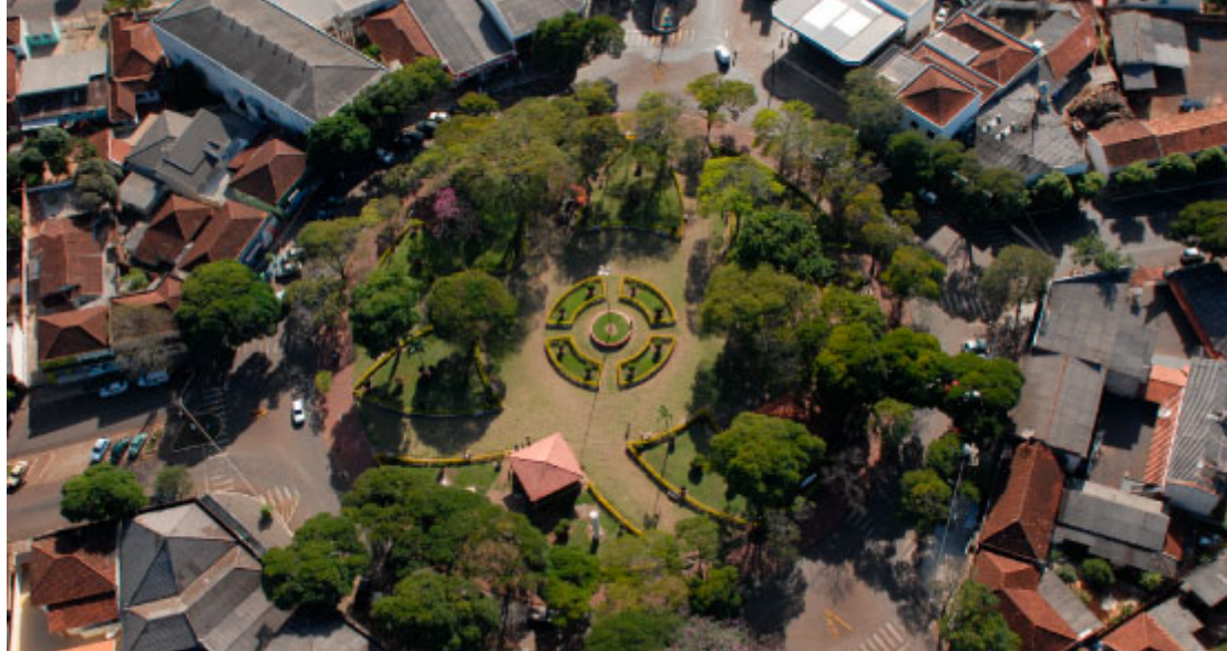
Praça Santos Dumont