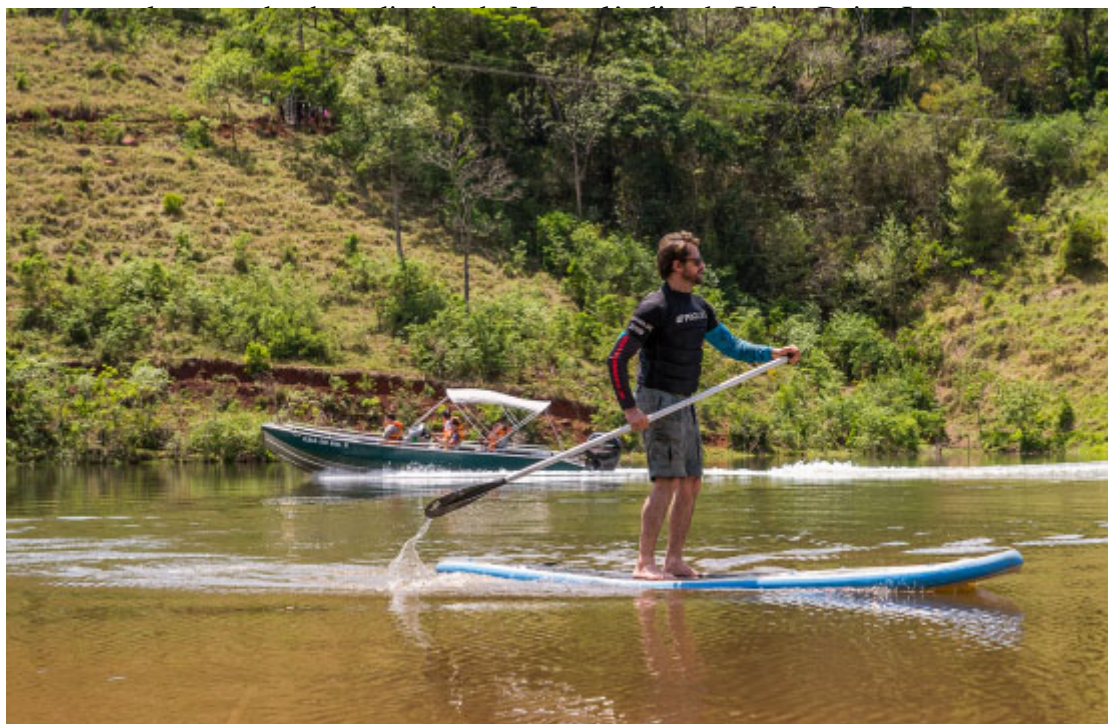
Stand Up Paddle

Se você gosta de saborear aquela comida caseira feita no fogão a lenha ou se jogar em uma boa aventura respirando o ar do campo, o lugar certo para você sentir essas experiências é em Realeza. Você que gosta de experiência ainda maior, pode fazer rapel nas cachoeiras, stand up