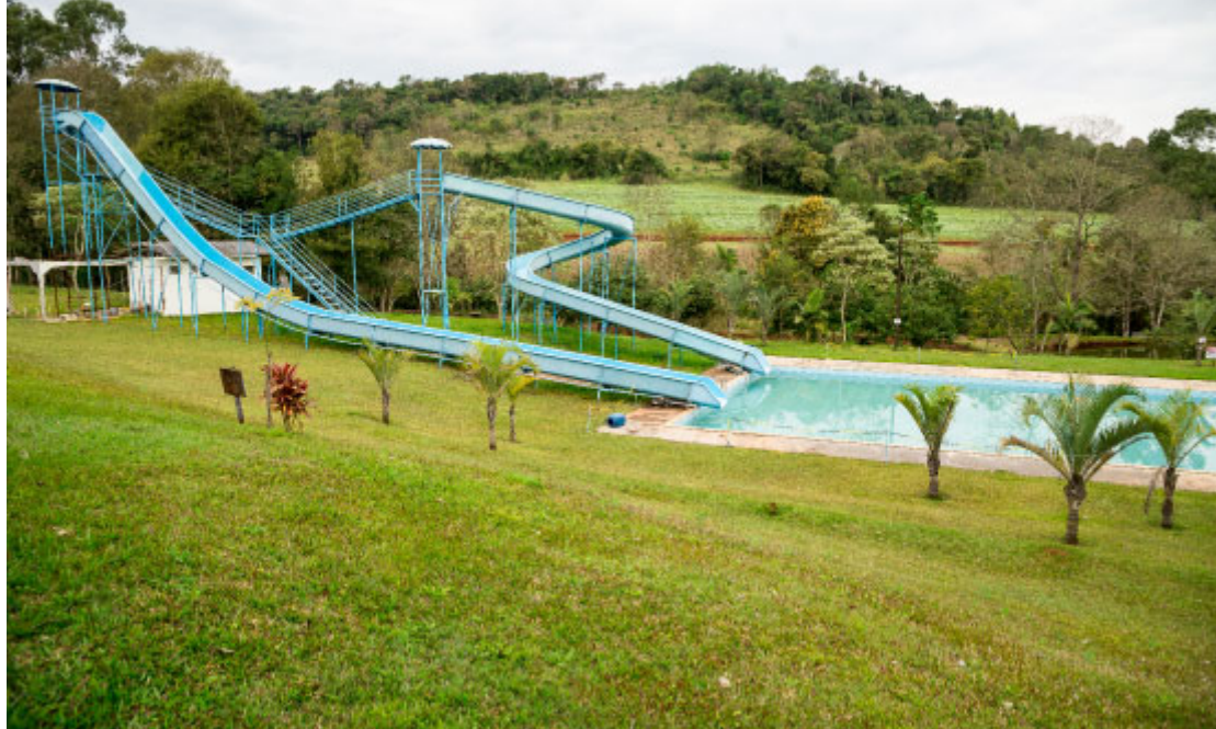
Recanto das Águas - Foto: Prefeitura de Realeza