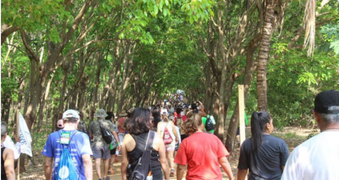
Caminhada na Natureza