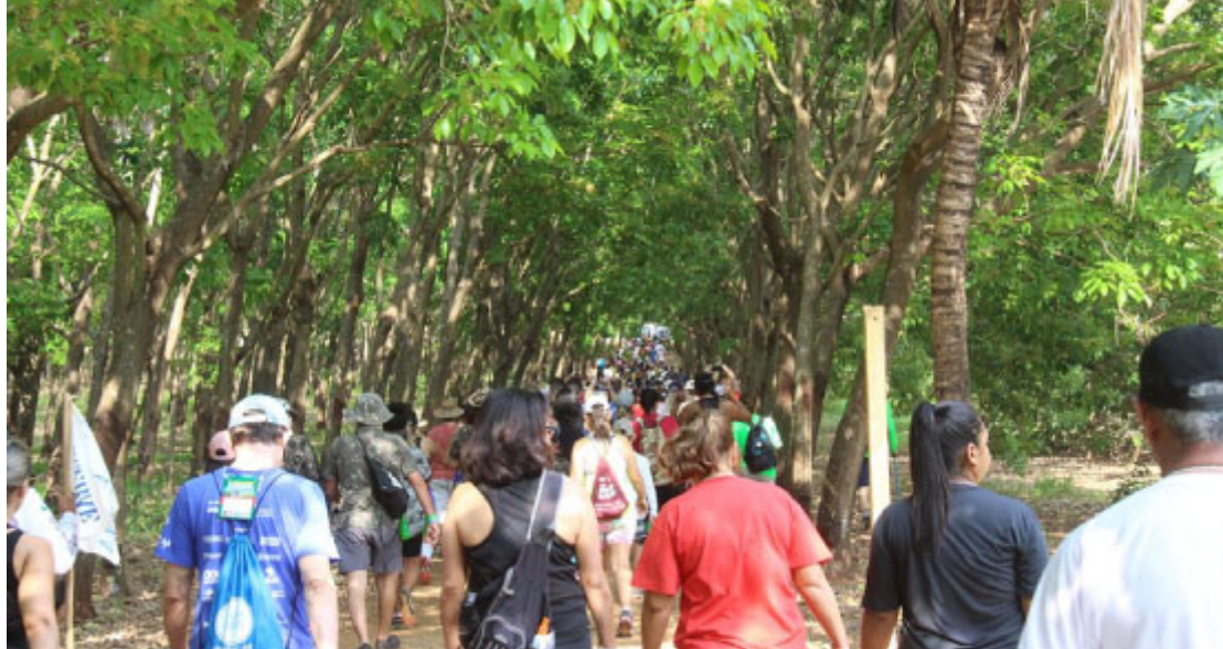
Caminhada na Natureza