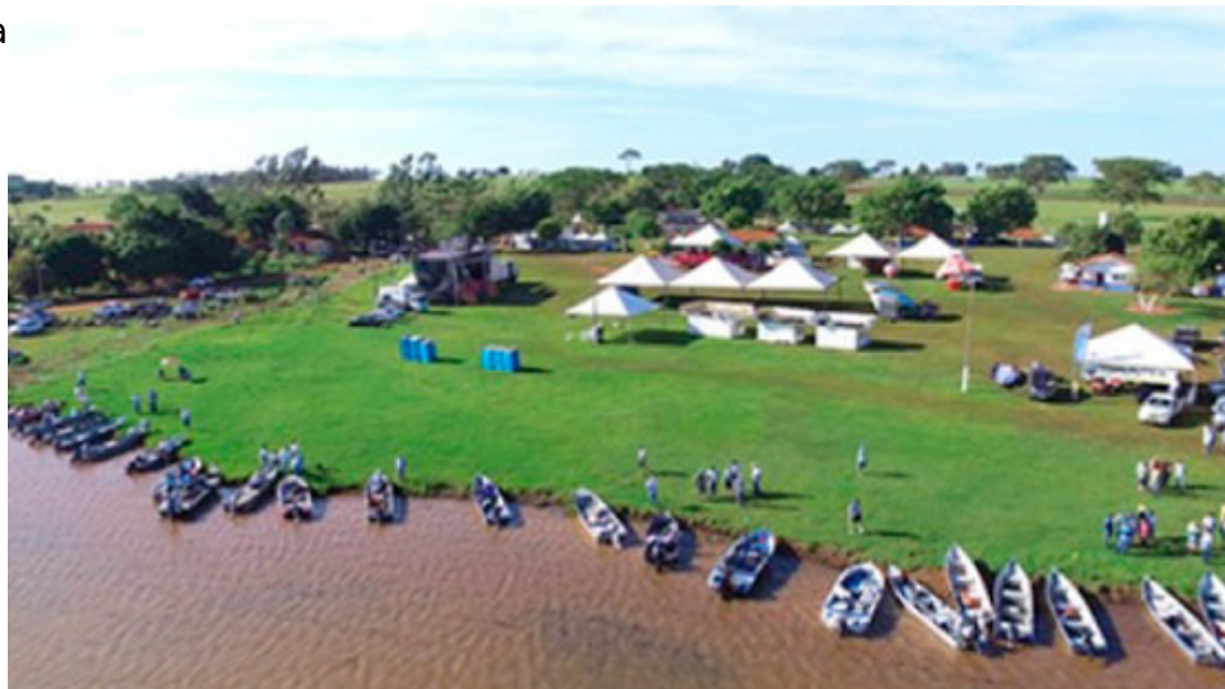
Torneio de Pesca