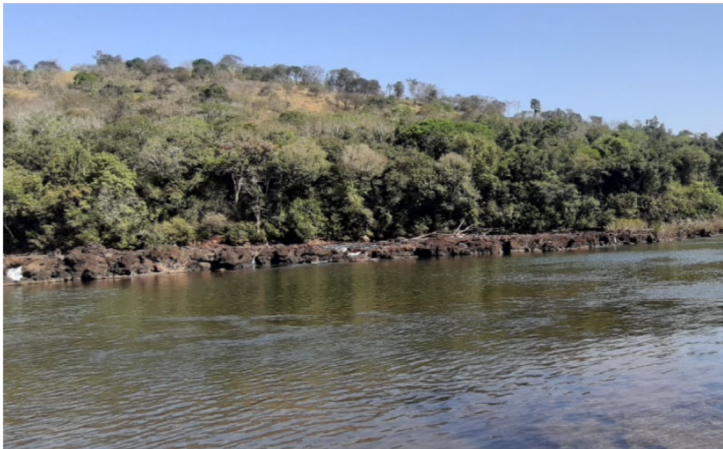
Rio Piquiri